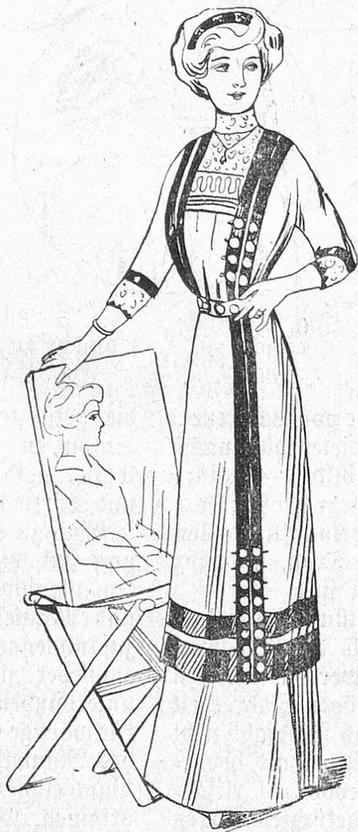
Fig. 1. Kleid in Kussenform aus Wollstoff mit Treppenbesatz.

Der große Turban aus altem verblaßtem Seidenbrokat, aus Metallstoffen auf das ungeheuerlichste drapiert, mit riesigen Nigretten, dichten Federtuffen verziert, der Turban, aus zweifarbigem Seidenmusselin oder Tüll gedreht und mit voluminösen Rosen garniert! Und natürlich der Turban aus Strohgeflecht und Bast (Abb. 2 und 3). — Brauche ich