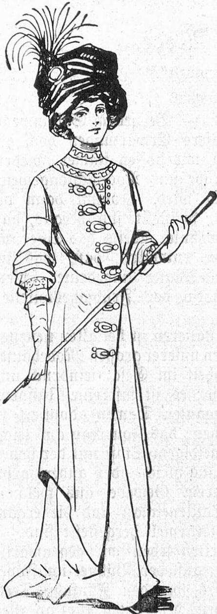
Fig. 2. Kleid aus grüner Seide mit verschleiernder Voiletunika.

Farbenzusammenstellung. Eine Neuerung bringen diese Roben naturgemäß mit sich — die abstechende Jacke aus englischen Geweben oder aus glatten einfarbigen Stoffen, die seit Jahren durch die Kostüme verdrängt waren. Ueberhaupt ist es ein charakterisierendes Merkmal unseres heutigen Geschmacks, abstechende Farben und Stoffe zu vereinen; nie war die Verwendung des Schongetragenen, des Aufbe-