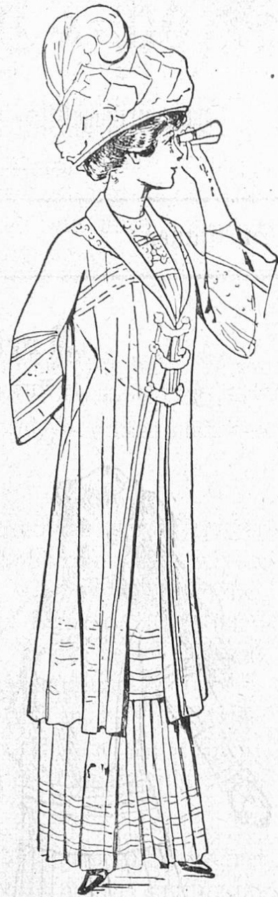
Fig. 3. Schleiermantel aus te Aufschläge, Voile-Ninon für Rennen usw.

wahrten so erleichtert wie gerade jetzt, und dies dürfte mancher praktischen Frau als eine recht angenehme Mode-laune erscheinen. Die Tail-leurs sind kompliziert und phantasiereich kombiniert. Die Röcke u. Jacken zeigen die übereinstimmenden Arrangements: Banneaux, übereinandergeklappte oder geknöpf-