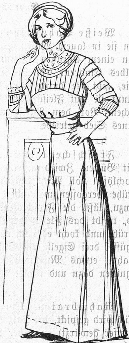
Fig. 7. Einfaches Kleid aus zweierlei Stoff (Rock u. Mieder aus Tuch, Taille aus Tüll).

knapp, sehr in die Taille geschnitten, meist ärmellos, nur mit einer Achselspange versehen; die Beinkleider kurz, sehr eng, vermeiden umfangreiche Garnitur; Spitzeneinsätze mit Bandedurchzug, feine Stickerei mit Spitzeninkrustationen und Bandschleifen sind allein gestattet; nichts was Platz brauchen und die Linie beeinträchtigen könnte. Sehr beliebt sind natürlich die schlanken Kombinationen, die allen von der Mode an Hemden u. Beinkleidern gestellten Anforderungen am besten gerecht werden können. — Die weißen Batist- und Linonunterröcke sind verschwenderisch mit Volants (aber eng anliegend und fast nicht eingereicht), Spitzen und Stickereien verziert; breite Bänder durchziehen die Einsätze od. einen in durchsichtigem Stoff angebrachten Saum.