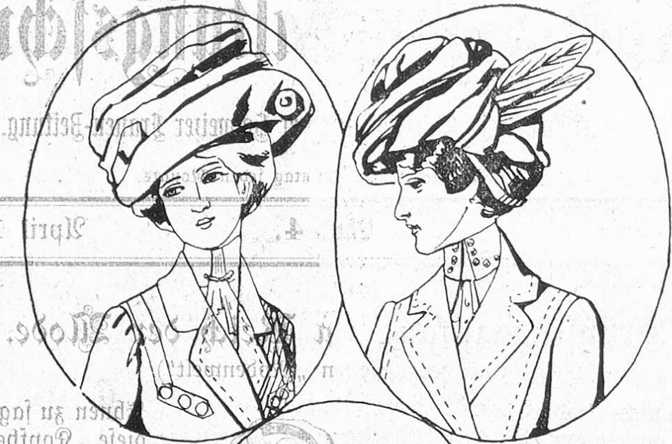
Fig. 2. Turbanhut aus Metallstoff oder Strohgeflecht.