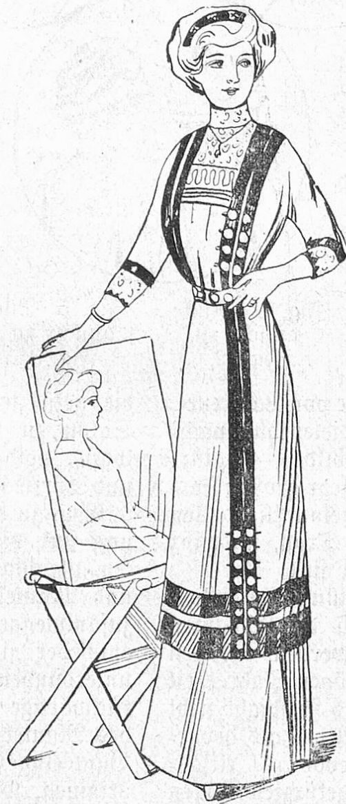
Fig. 1. Kleid in Kussenform aus Wollstoff mit Treppenbesatz.

Der große Turban aus altem verblaßtem Seidenbrokat, aus Metallstoffen auf das ungeheuerlichste drapiert, mit riesigen Nigretten, dichten Federtuffen verziert, der Turban, aus zweifarbigem Seidenmusselin oder Tüll gedreht und mit voluminösen Rosen garniert! Und natürlich der Turban aus Strohgeflecht und Bast (Abb. 2 und 3). — Brauche ich