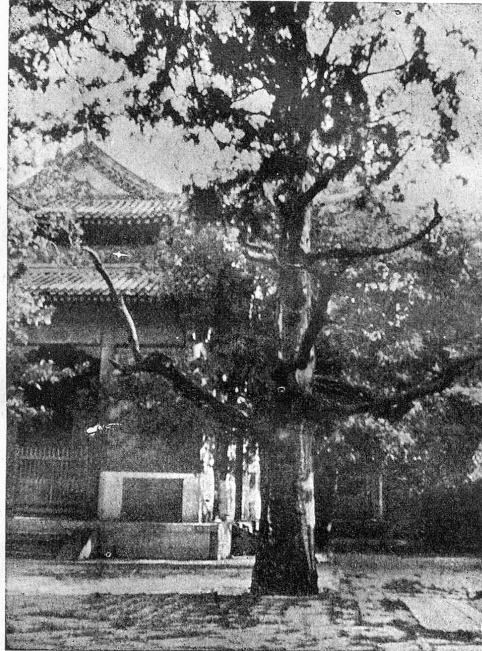
Tempel mit Grab im Konfuziustempel in Peking.

tochter (Mandarin ist ein hoher, chinesischer Würdenträger). Zweitens erblicken wir einen Kriegsgott mit all' dem heidnischen Krimsstrams, vorab einem mystischen Gesichtsausdruck und überschwänglichen Körperschmuck. Der von den jüngsten Anhängern der republikanischen Staatsform angebetete Kriegsgott zeigt außer den natürlichen zwei Armen noch drei Paar unnatürlicher Zwergarme. Das dritte Bild stellt den Konfuziustempel dar und das Schlußbild bietet eine Straßenszene in der Hauptstadt Peking, wo besonders der von Lastdienern gezogene Einspänner mit seinem herrschaftlichen Fahrgast eine drollige Figur macht. Dieses Fahrzeug wird in China noch sehr viel gebraucht.