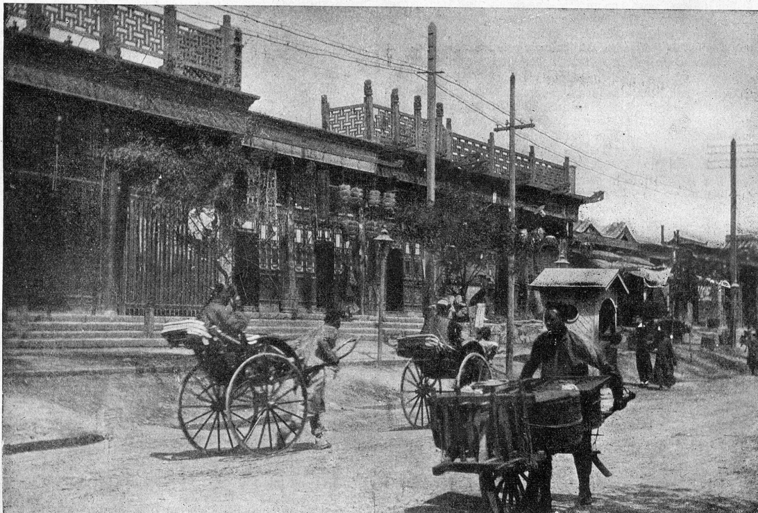
Straßen-Szene in Peking.