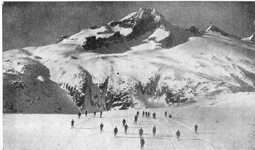
Militär-Ski-Kurs in Andermatt. Abfahrt auf dem Rhonegletscher. — Blick gegen Nägelisgrättli.