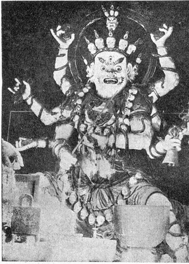
Ein chinesischer Kriegsgott.