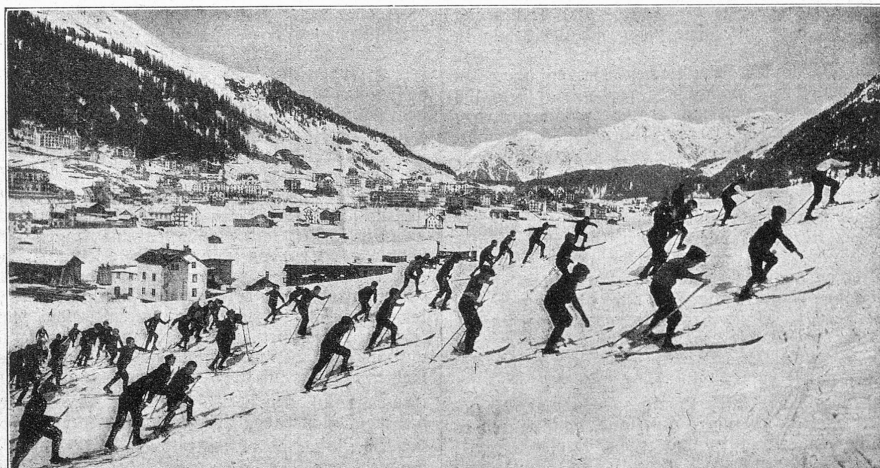
Vom großen Davoser Skirennen im Februar.

Auch ein Knaben-Wettlauf wurde veranstaltet, an dem sich eine große Schar sportsfreudiger Knaben beteiligten.