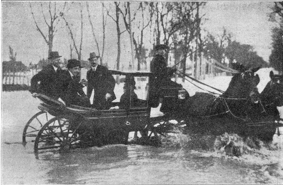
Der König von Spanien bei den Ueberschwemmungen von Sevilla. Alfons (+) fährt durch die überschwemmten Straßen in einem Wagen, dessen Pferde scheuen.