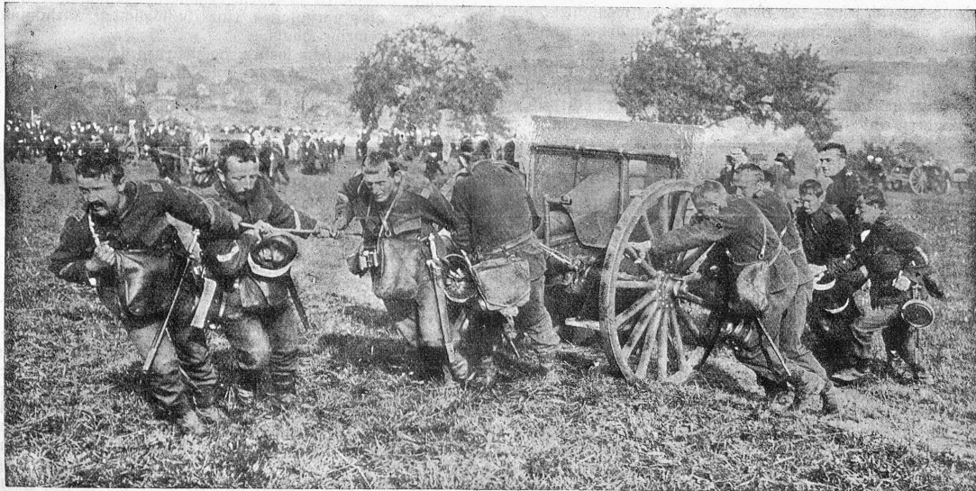
Im Feuer zurückgehende Batterie.

Der alte Mann schüttelte bekümmert das Haupt. Halb-laut erwiderte er: Man darf eben nicht erlahmen. Kampf ist das Leben, und scheint ein Sieg auch in Himmelsferne, man muß ihn doch erstreben. Es ist ein so kleines Feld hier zum Säen und zum Bebauen, und mühsam das Werk, auf hartem, widerspenstigem Grund und Boden. Klein ist dann