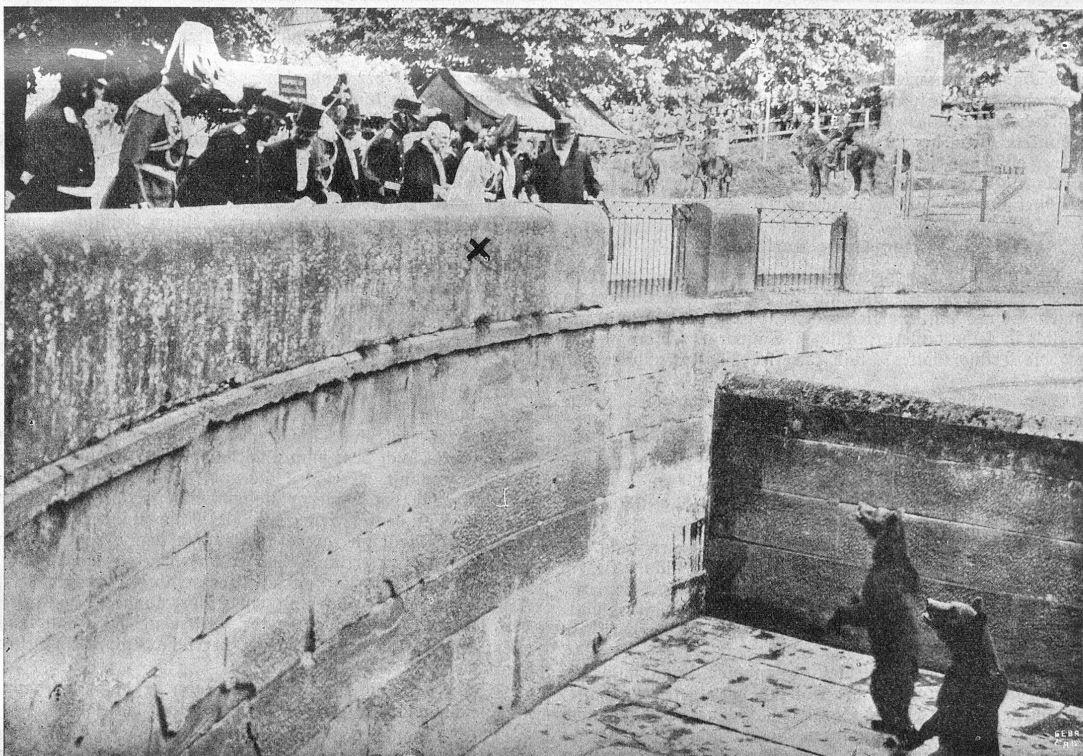
Der Kaisertag in Bern: Begrüßung der kaiserlichen Majestät durch die Muzen.

Eine Weile versanken beide in nachdenkliches Schweigen. Laute Zurufe, Sodeln und Gelächter draußen auf der Straße führten sie wieder in die Wirklichkeit zurück. Des jungen Freundes fester, herber und entschlossener Gesichtsausdruck