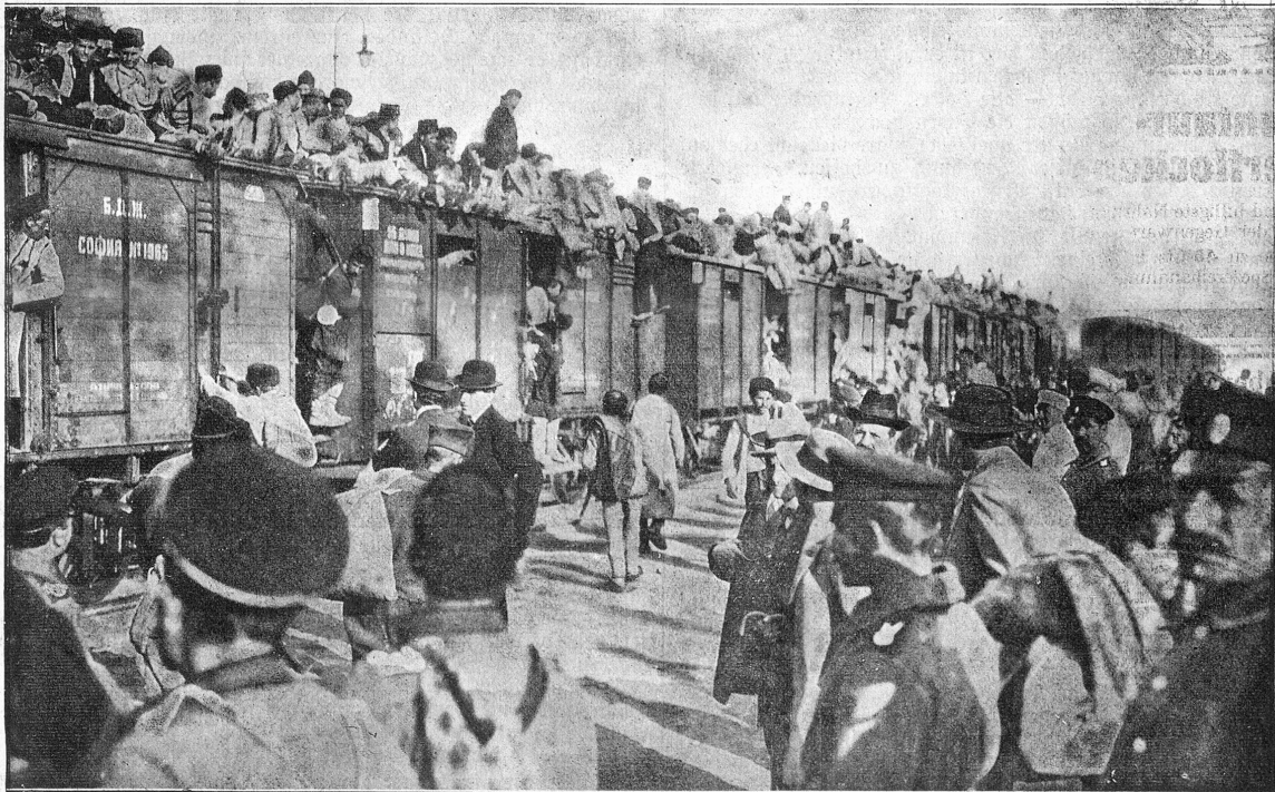
Einparkierung von bulgarischen Reservisten in Sofia, Hauptstadt Bulgariens.

Im Keller macht der Wein Bekanntschaft Mit klarem Brunnenwässerlein, Und über allen diesen Freveln Lacht schelmischer Herbstjonnenschem! —ich.