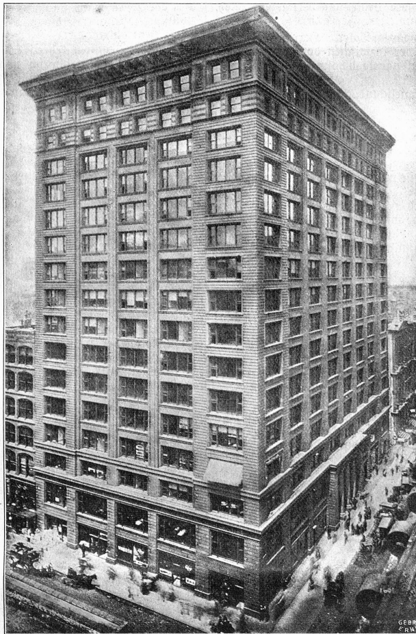
New Yorker Wolkenkratzer, nach dem einfachen Zweckmäßigkeitsprinzip erbaut.

„Daß Sie ganze Nächte hindurch spielen!“