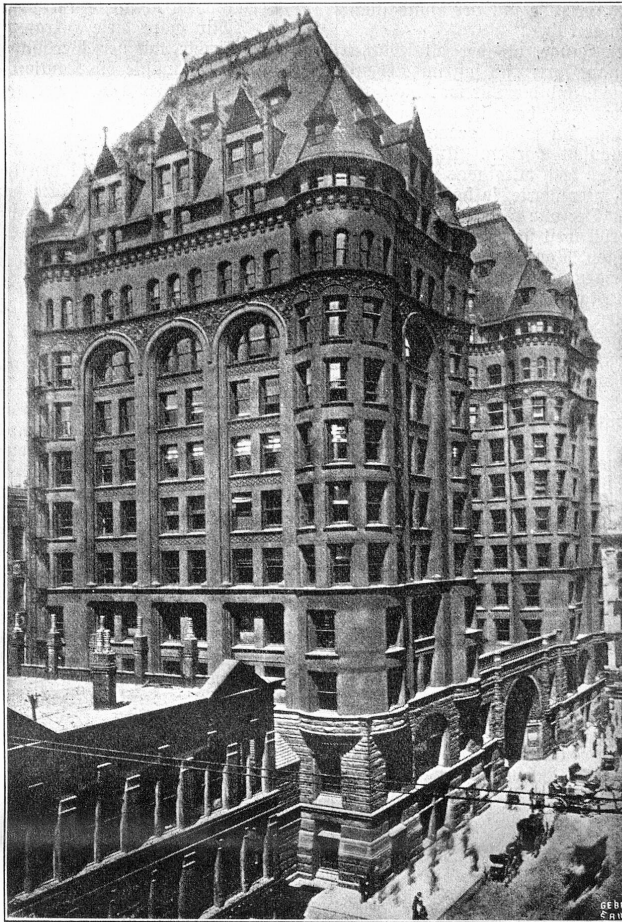
Newyorker Wolkenkratzer mit architektonischer Ausgestaltung.

„Und kannst auch später drüben untergehen, wie schon so Mancher untergegangen ist.“ unterbrach ihn der Vater, der wieder auf und nieder wanderte. „Du glaubst, ich sei ein reicher Mann, aber ich bin es nicht. Meine Praxis ist nicht