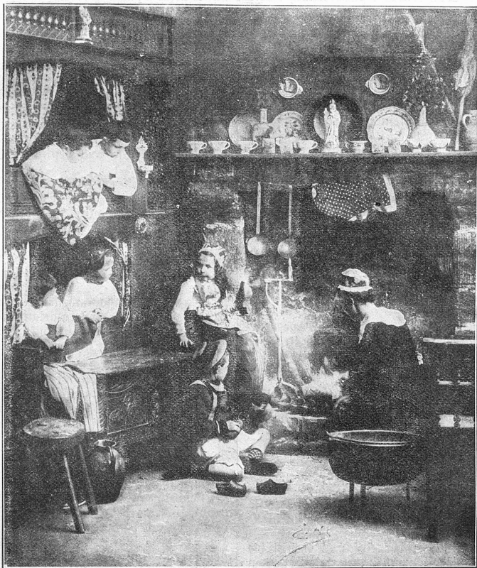
Weihnachtsmorgen in einem Bauernhof in der Bretagne.

Sie ließ die Hände sinken und erhob zu ihm den Blick, in dem eine unlagbare Angst sich verriet. „Was führt dich zurück?“ fragte sie. „Ich habe dich längst nicht mehr unter den Lebenden geglaubt —“ (Fortsetzung folgt).