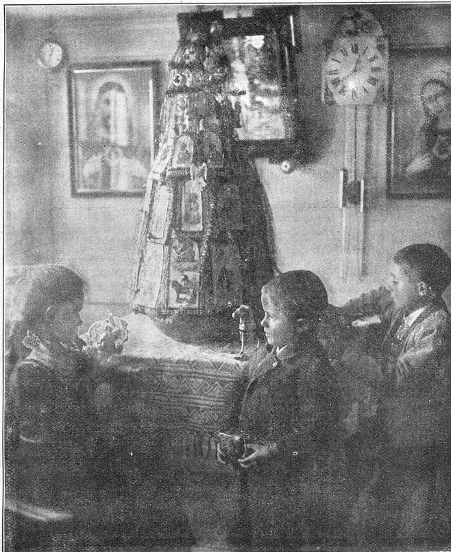
Weihnachten in Appenzell: An Stelle des Christbaumes steht ein Aufbau aus Lebkuchen, die mit Bildern geschmückt und mit allerhand Zierrat aufgeputzt sind.

„Wieder ein weiser Spruch!" nickte Simon Riese. „Na, es sind nicht alle Menschen so furchtlos wie Sie. Wohnt die Witwe des Ermordeten auch noch unter diesem Dache?"