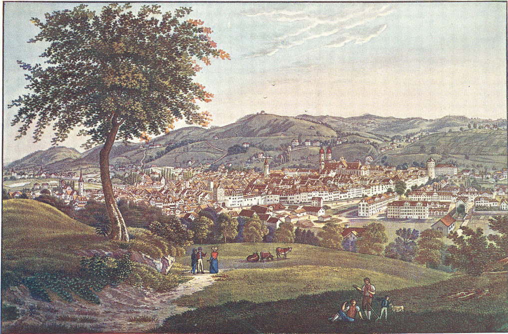
Die Stadt St. Gallen vom Rosenberge aus im Jahre 1838.