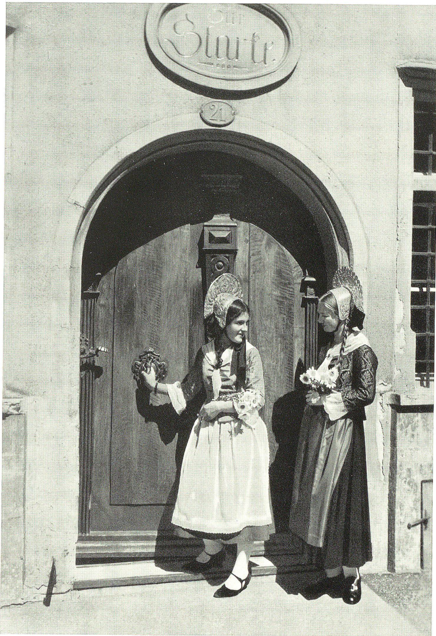
St. Gallen, aus der Altstadt