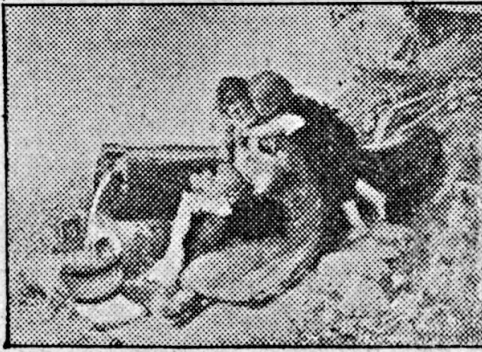
Muttergück, Grob farbig 32 x 49 cm Fr. 8.25 einfarbig auf Karton 46 x 64 cm Fr. 5.75

Farbige, originalgetreue Kunstblätter alter und moderner Meister der Europ. Kunstgalerien. — Ansichten, Landschaften und Volkstypen der Schweiz und aller Erdteile. — Künstlerisch gediegener Wand- und Zimmerschmuck , für Geschenke, Sammler und Schulen.