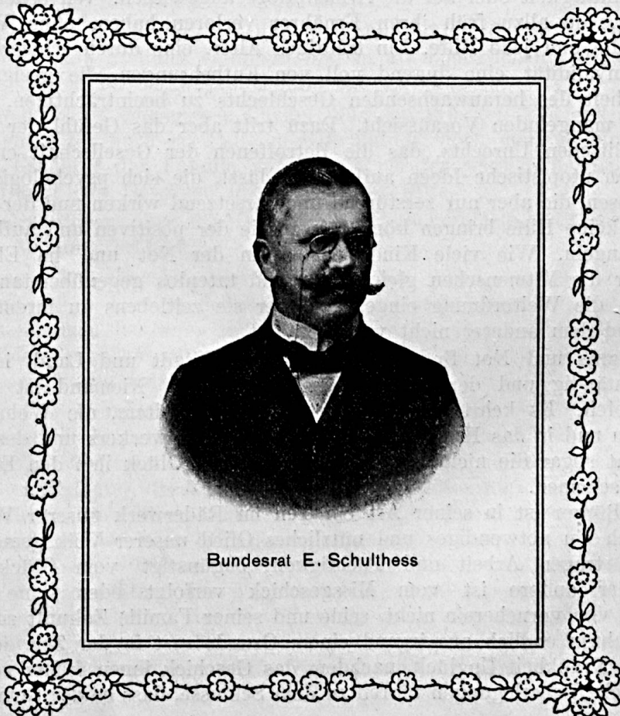
Bundesrat E. Schulthess

Inhalt: Alters- und Hinterlassenenversicherung. — Unsere Alten. — Wir Frauen und die eidg. Abstimmung am 6. Dezember. — Verein ehemaliger Schwandschülerinnen. — An die Sektionen. — Die Bedeutung des Gemüsebaus für Haus- und Volkswirtschaft. — Wichtig für die Vorstände der Frauenvereine im Kanton Zürich. — Aus schweizerischen Frauenkreisen. — Zum Andenken an Arnold Ott.