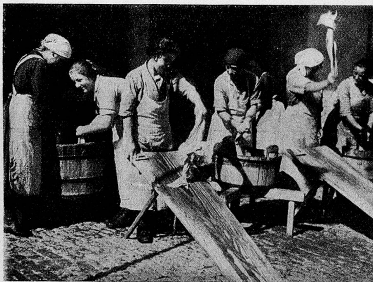
Aus der hauswirtschaftlichen Schule Schwand. Beim Waschen.

Die in der Landwirtschaft betätigten Schülerinnen gliedern sich in : Selbständige Bäuerinnen 126 = 25,40 %, Pächters- und Verwaltersfrauen 67 = 13,50 %. Verheiratete Frauen auf elterlichem Betrieb 38 = 7,67 %. Stütze im Elternhaus oder bei Verwandten 250 = 50,40 %. Angestellte in fremdem Betrieb 15 = 3,03 %.