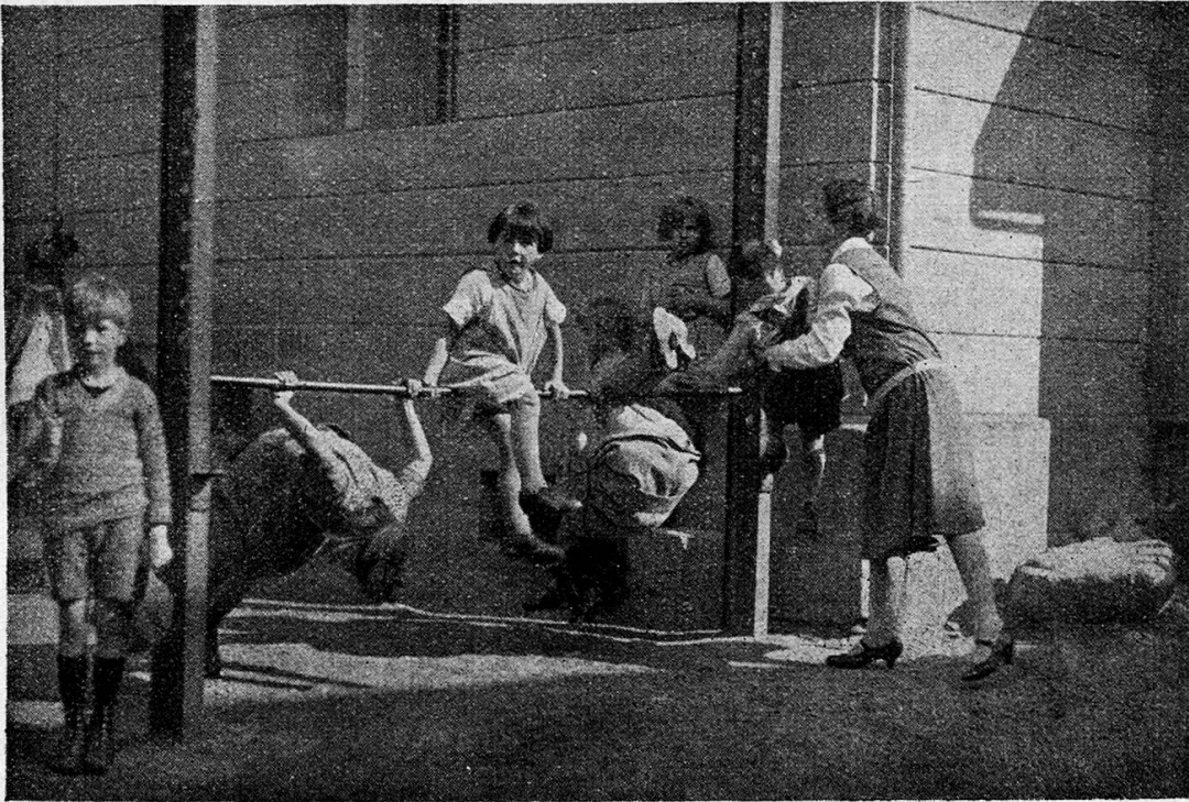
Turnstunde im Tagesheim und Mädchenhort Länggasse-Bern

Nun kam ein neuer Gedanke von Frau Stämpfli, der weitblickenden