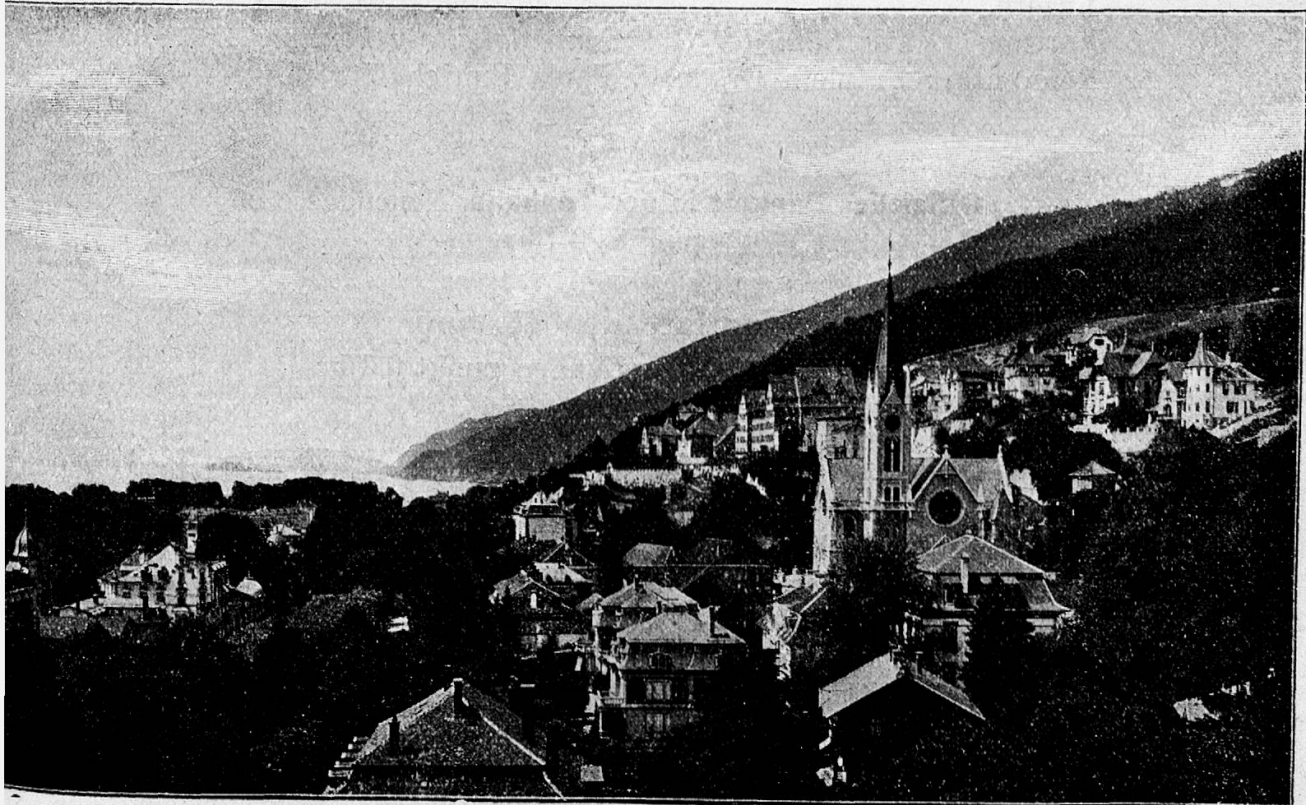
Gesamtansicht von Biel

Inhalt: Einladung zur 47. Jahresversammlung des Schweizerischen gemeinnützigen Frauenvereins. — 47 e Assemblée générale de la Société d'utilité publique des femmes suisses. — Biel, die Stadt unserer Jahresversammlung (mit 4 Bildern). — Anmeldebogen. — Aus dem Zentralvorstand. — Aktion „Für unser Bergvolk“ 1934. — Jahresrechnung des Schweizerischen gemeinnützigen Frauenvereins. — Schweizerische Pflegerinnenschule mit Frauenspital in Zürich. — Aus den Sektionen. — Ausstellung. — Frauenberufe. — Die Gräfin Grisapulli (Fortsetzung). — Verteilung der Ergebnisse der Bundesfeiersammlung 1934. — Vom Büchertisch. — Inserate.