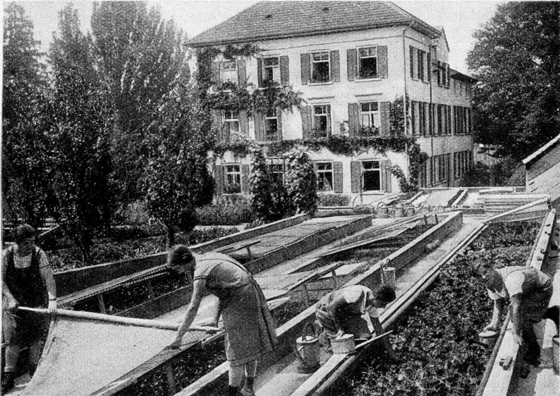
Schweizerische Gartenbauschule für Töchter in Niederlenz

Die praktischen Arbeiten in Gemüse- und Blumenkulturen wurden mit verschiedenen Versuchen von allerlei Gemüse- und Blumensorten verbunden; es wurden auch wieder eine Anzahl Düngungsversuche durchgeführt.