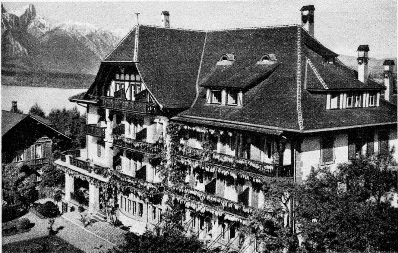
Der „Seehof“ in Hilterfingen

In Hilterfingen am Thunersee, fand am 1. Juni die vierte Generalversammlung der « Genossenschaft Seehof, alkoholfreies Hotel in Hilterfingen » statt. Die vorangegangenen Sitzungen des Vorstandes und des Genossenschaftsrates hatten die laufenden Geschäfte so vorbereitet, daß sie durch die Generalversammlung rasch erledigt werden konnten. Der vorliegende Jahresbericht wurde