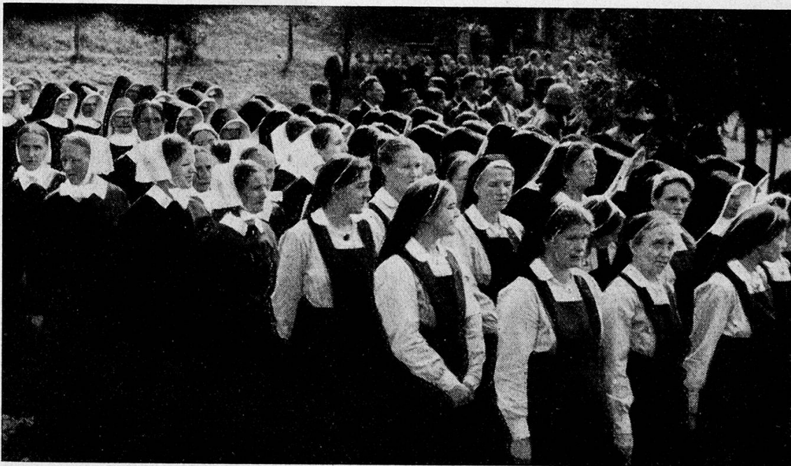
Mobilisation September 1939 — Zug der Schwestern auf dem Weg zur Vereidigung

gen hat erwiesen, daß die Erwerbung einer Fr. 1000 betragenden Jahresrente bei den erhöhten Ansätzen vielfach nicht mehr tragbar wäre. Die Schule legte im Berichtsjahr Fr. 12,960 aus, um 69 Schwestern in Haus und Stationen die Prämienzahlung zu erleichtern. Für weitere Fürsorge und Ausbildung entnahmen wir den verschiedenen Fonds rund Fr. 8980. Für die erhaltenen Gaben im Betrag von Fr. 3674 und für die freiwilligen Rückerstattungen von Fr. 1446 danken wir allen Spendern herzlich.