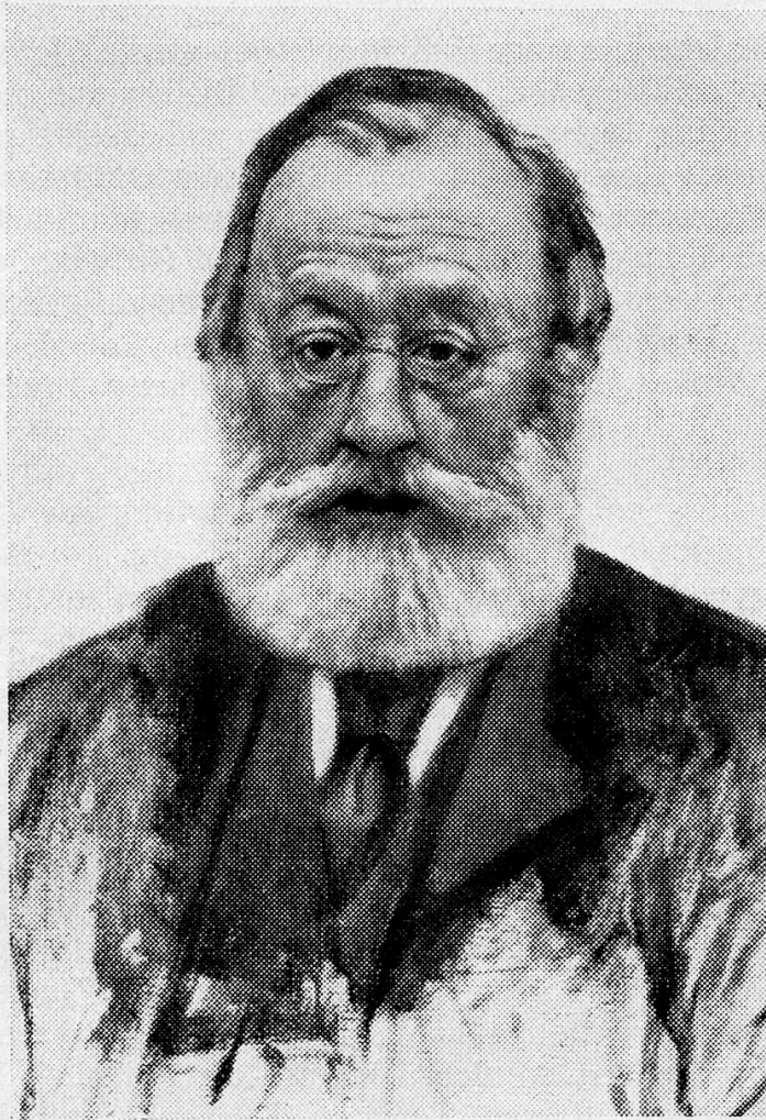
Nach dem Oelbild von Karl Stauffer