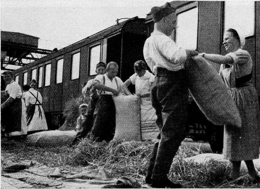
Der Sanitätszug wird für Transporte hergerichtet