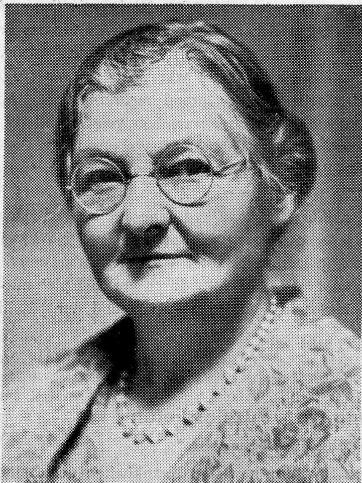
Miss Margaret Bondfield