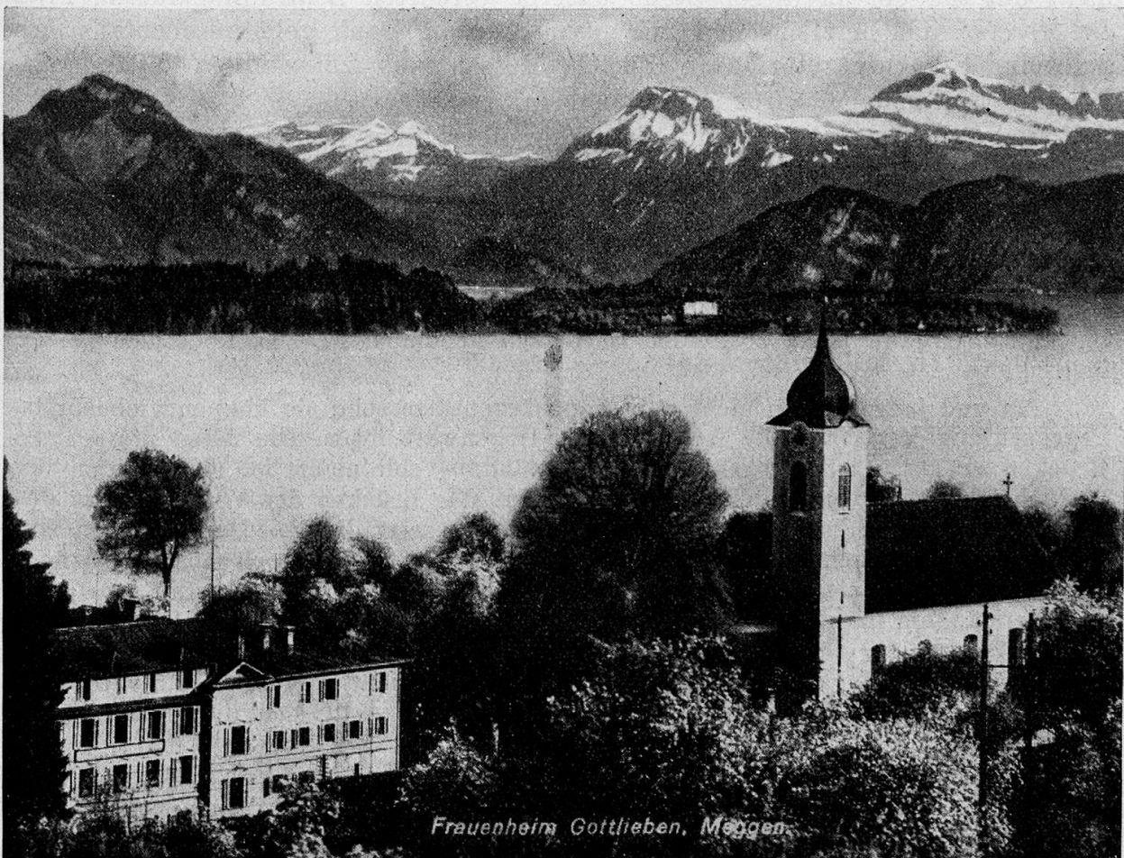
Frauenheim Gottlieben, Meggen

Der Kantonalverband führt auch eigene Fürsorgewerke. Als erstes erwähne ich die im Jahre 1920 gegründete Kinderstube Hubelmatt. Die Auswirkungen des unheilvollen Weltkrieges 1914/1918 waren in der Nachkriegszeit besonders in sozialer Hinsicht durch schwere Störungen gekennzeichnet. Wohnungsnot, Arbeitslosigkeit usw. zeitigten unter der nicht begüterten Bevölkerung und besonders in kinderreichen Familien verhängnisvolle Folgen. Unter solchen Verhältnissen wurde ein Zusammenleben der Familienglieder vielfach erschwert und eine anderweitige, meistens vorübergehende Versorgung der Kinder zu einer