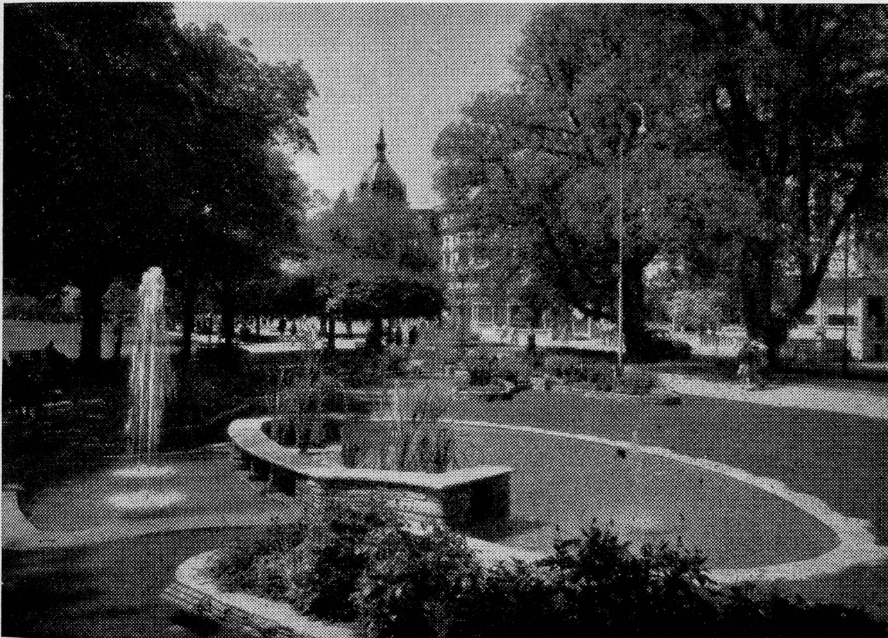
Der Höheweg in Interlaken

vom Hauptbahnhof entfernt auf « fremdem Unterseener Boden », außerhalb der Gemarchen Interlakens.