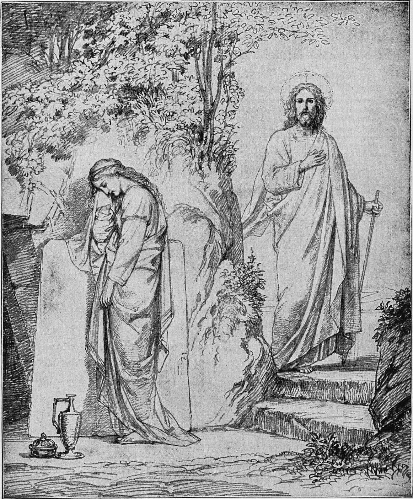
Christus der Auferstandene

Christus ist glorreich auferstanden, und schlichte Frauen, Nachfolgerinnen Jesu, Maria Magdalena, Johanna und Maria, des Jakobus Mutter, waren die Botschafter der Gottestat!