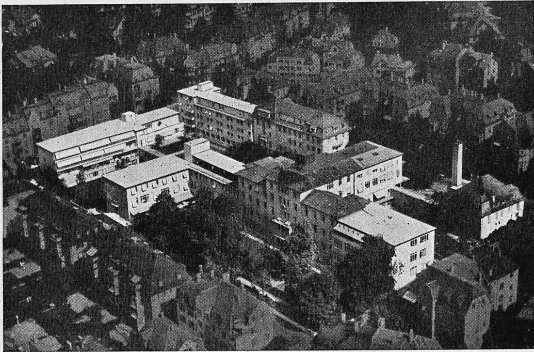
Schweizerische Pflegerinnenschule mit Krankenhaus in Zürich