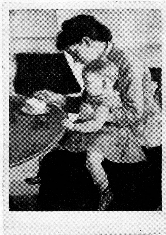
«Mutter und Kind», ein selten gesehenes Hodler-Bild, das für eine der fünf Pro-Juventute-Karten verwendet wurde.

Eine große Überraschung bilden die fünf Pro-Juventute-Ansichtskarten, die gute Reproduktionen von mehr oder weniger bekannten Bildern Ferdinand Hodlers in alle Welt hinaustragen.