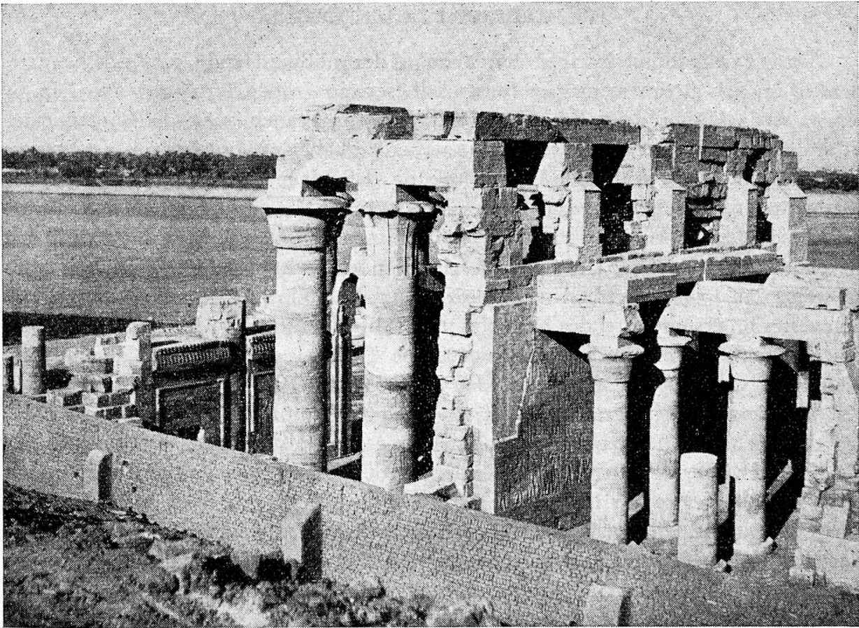
Tempel in Kom Ombo