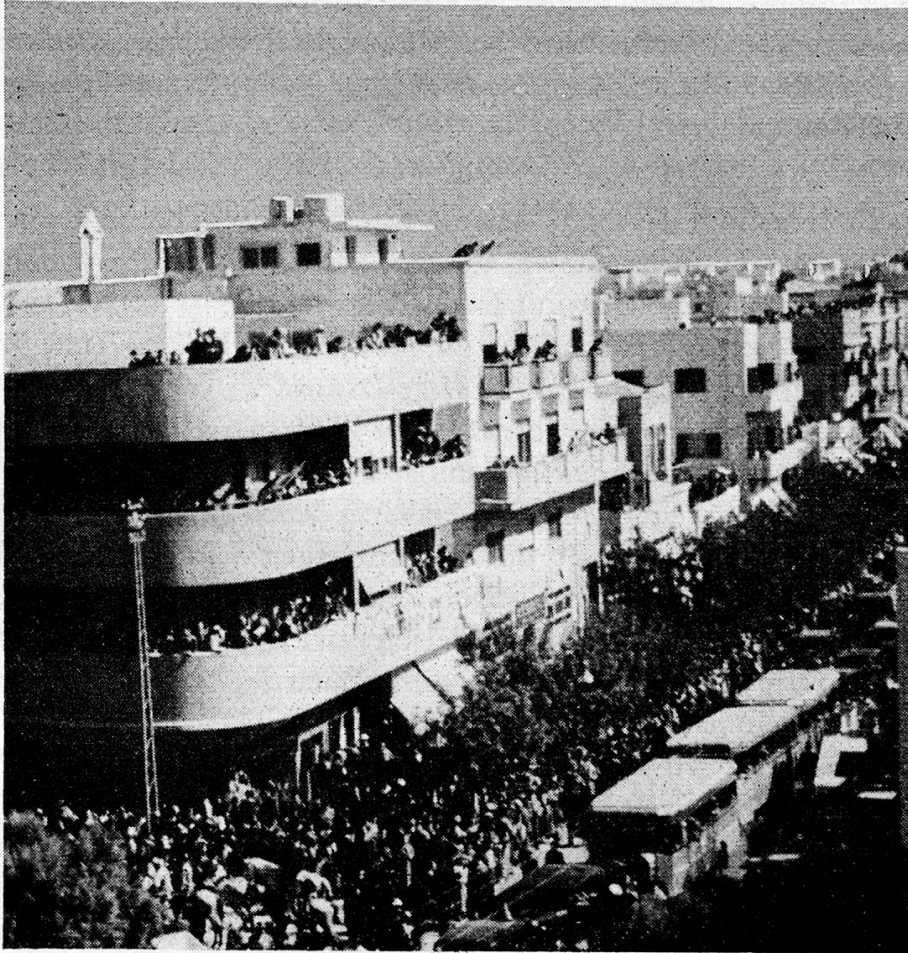
Tel-Aviv ist eine Stadt, die ganz nach modernen Gesichtspunkten aufgebaut wurde.

Diese Familie ist «Mayflower», wie unsere Freunde schmunzelnd sagten; denn sie wohnen bereits seit der siebenten Generation im Lande. Ihr Urahn gehörte zu den Pionieren von Petha-Tiqvah (Tor der Hoffnung), der ersten jüdischen Heimstätte, und er hat damals seinen Verleger- und Journalistenberuf aufgegeben, um Orangen, Mandarinen und Zitronen zu pflanzen, was heute sein betagter Urenkel noch tut.