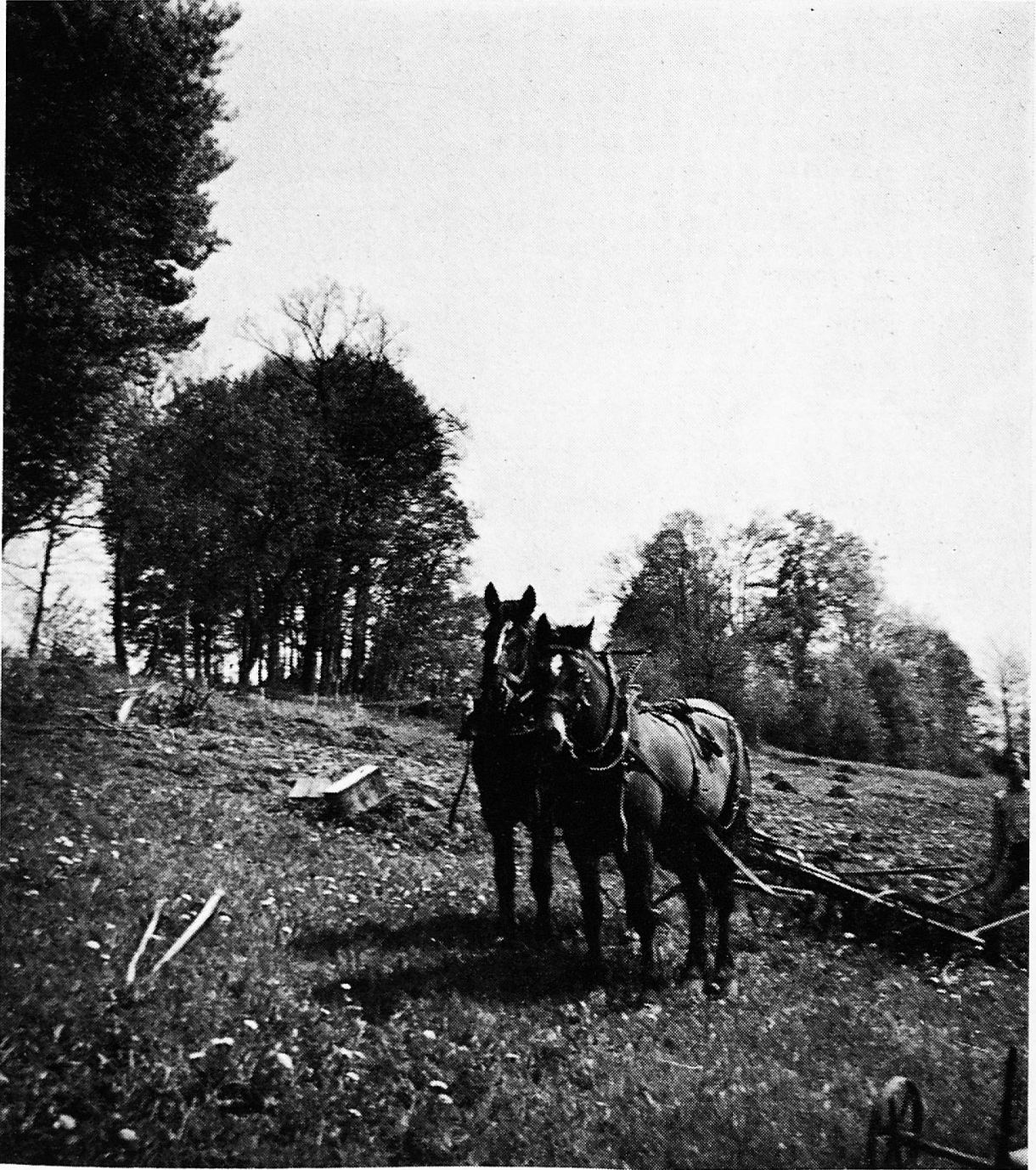
Begegnung auf einer Ferienwanderung

Organe central de la Société d'utilité publique des femmes suisses