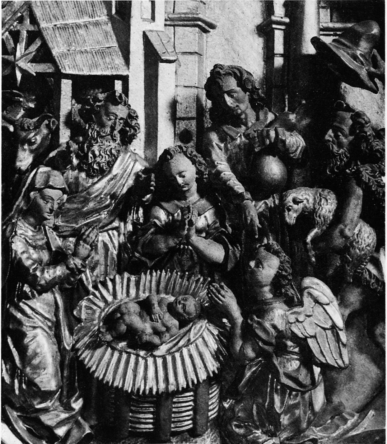
Rosenkranzaltar in Überlingen am Bodensee

Organe central de la Société d'utilité publique des femmes suisses