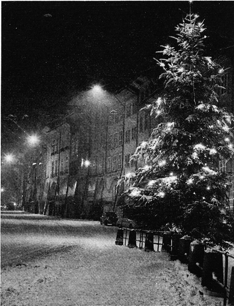
Alte Gasse in Bern im Weihnachtsschmuck