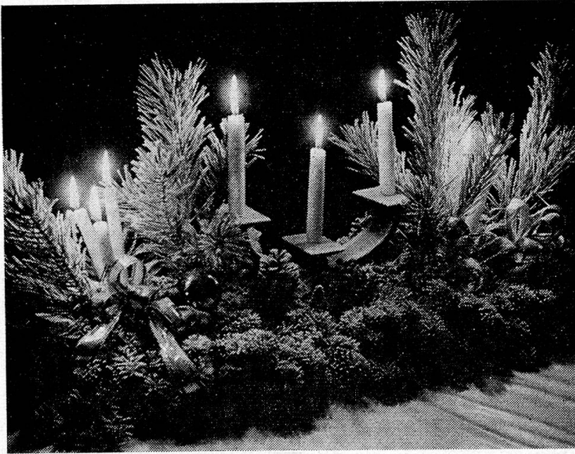
Glanz und Duft am Weihnachtsabend

darauf an, dass wir sie recht kurzweilig und unterhaltend gestalten. Wohl liegt der Sinn darin, dass wir einander Freude bereiten, durch unsere Geschenke die Bereitschaft zeigen, uns in die Welt des anderen hinein zu versetzen. Aber am Heiligen Abend und am Christtage sollen wir vor allem einander die Herzen öffnen im stillen Beisammensein, in unseren Worten, in unseren Gaben die Liebe zeigen, die unser wieder in den Alltag übergleitendes Leben so unendlich reich und wertvoll macht. Denn ohne die Liebe ist des Menschen Leben arm und freudlos. Das sollten alle jene nicht vergessen, denen das Dasein eine besondere Gunst erwiesen hat und die von schweren Schicksalsschlägen verschont geblieben sind. Und überall, wo Menschen froh und glücklich ihr Weihnachtsfest begehen können, sollten sie auch ein wenig an die Einsamen und Verlassenen denken, die abseits vom Wege des Glückes stehen. Und auch in jenem Familienkreis, wo der Tod das Jahr über eine Lücke riss und die Zurückgebliebenen schwer am Leide tragen, sollte einer dem andern in vermehrter Erschlossenheit des Herzens nahe sein. Suchen wir darum in der Weihnachtszeit all jenen Menschen mit der ganzen Wärme des Empfindens nahe zu sein, mit denen wir verbunden sind, damit die grosse Botschaft jener Tage sich erfülle: Friede den Menschen auf Erden!