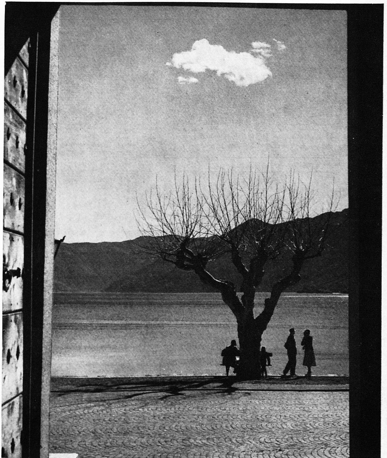
Erste Frühlingssonne in Ascona

Organe central de la Société d'utilité publique des femmes suisses