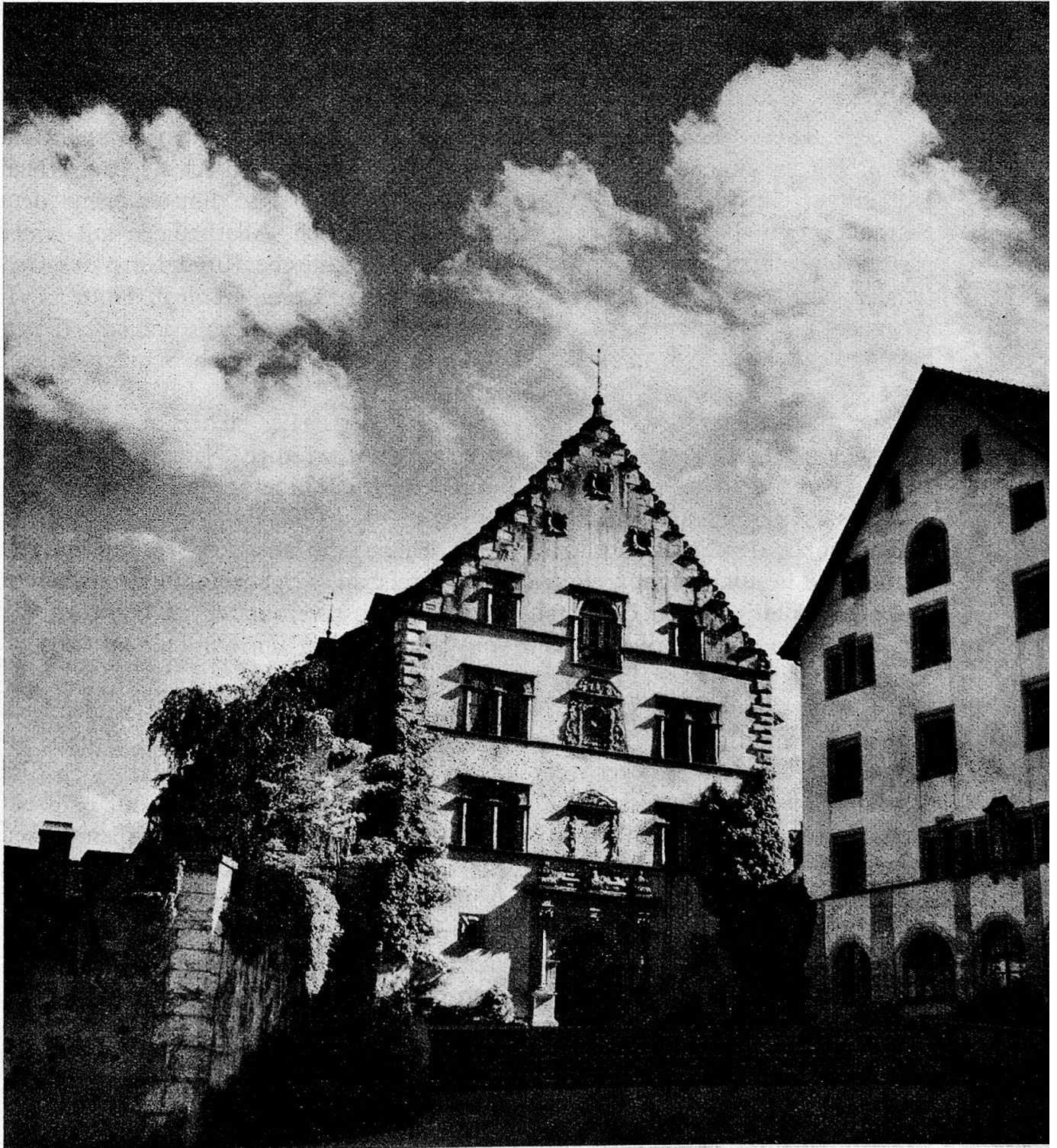
Das Regierungsgebäude (Beckenstube). Das alte Zeughaus ist zum Sitz der Regierung geworden; seine wuchtige Giebelfassade ist ruhig und massvoll geschmückt

Für die Wahl des Platzes soll – so erzählt der Schaffhauser Chronist Johann Jakob Rüeger – nach der Legende die Vision eines dem Grafen Eberhard befreundeten Einsiedlers ausschlaggebend gewesen sein, welcher im Traum aus