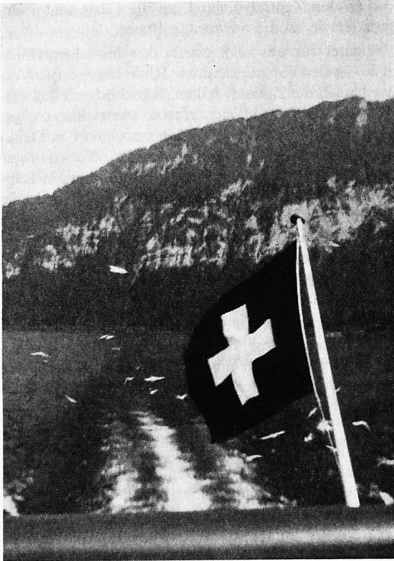
Sonne, Berge und blauer See umrahmen unser Schweizer Kreuz

Als ganz winziges Rädchen im grossen Getriebe dieser Geschäftigkeit hat sogar unsere Brockenstube ihren Anteil, indem sie die vielen Gastarbeiter, die heute unsere Fabriken bevölkern, mit billigen Möbeln und Hausrat versorgt.