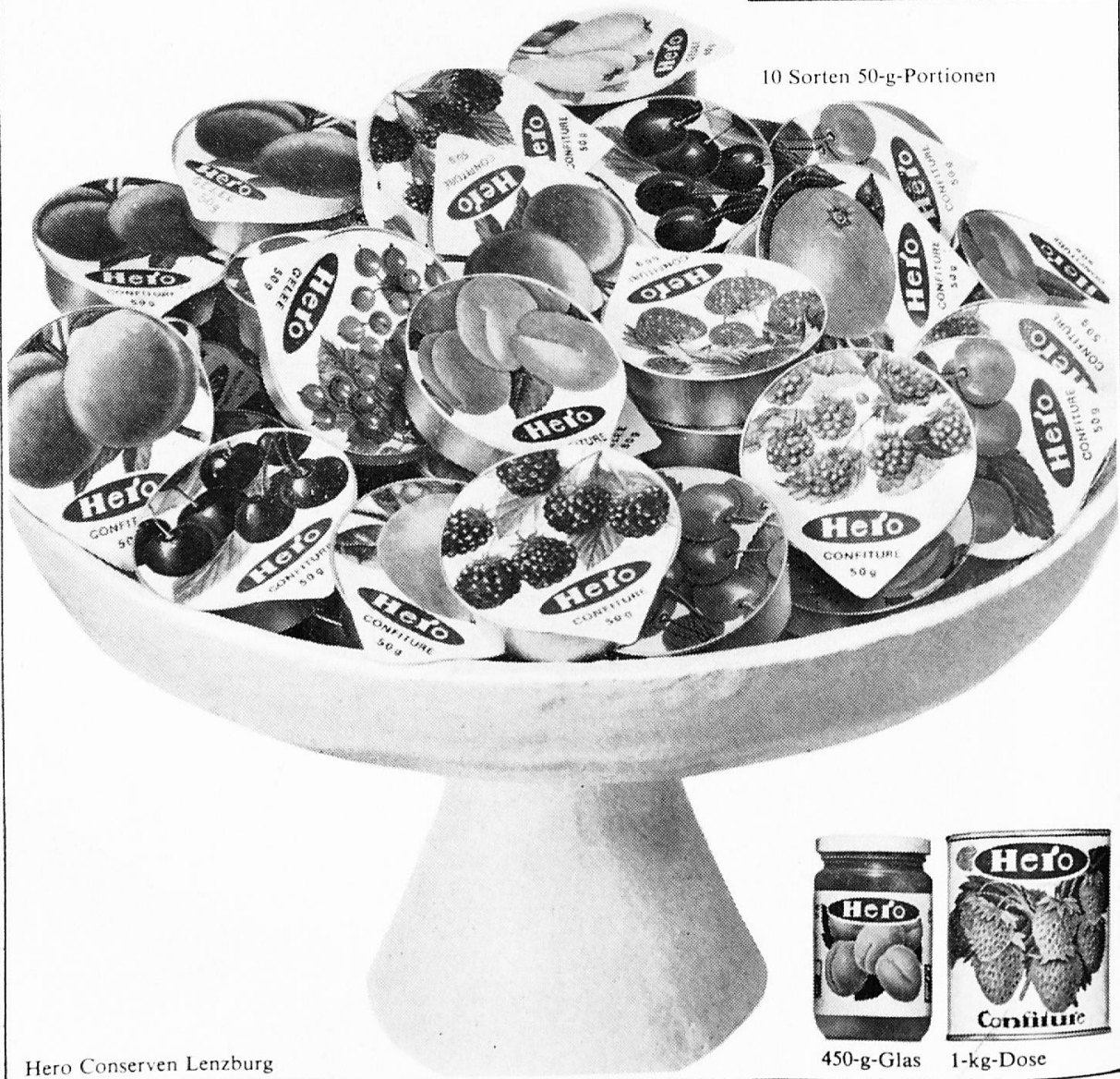
10 Sorten 50-g-Portionen

...dass die Hero in Lenzburg und Hallau viele Früchte- und Beersorten auf eigenem Boden anbaut?