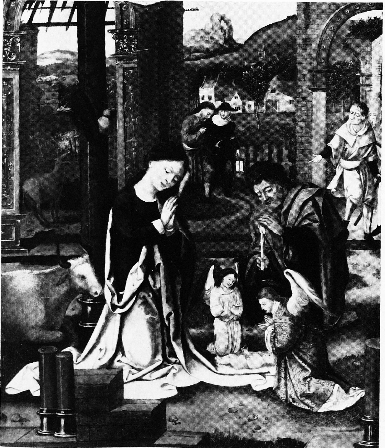
Christi Geburt, ein Gemälde von Dirk Vellert, der von 1511 bis 1544 in Antwerpen tätig war (Das Bild befindet sich heute im Besitz der Galerie Meissner, Zürich)

Organe central de la Société d'utilité publique des femmes suisses