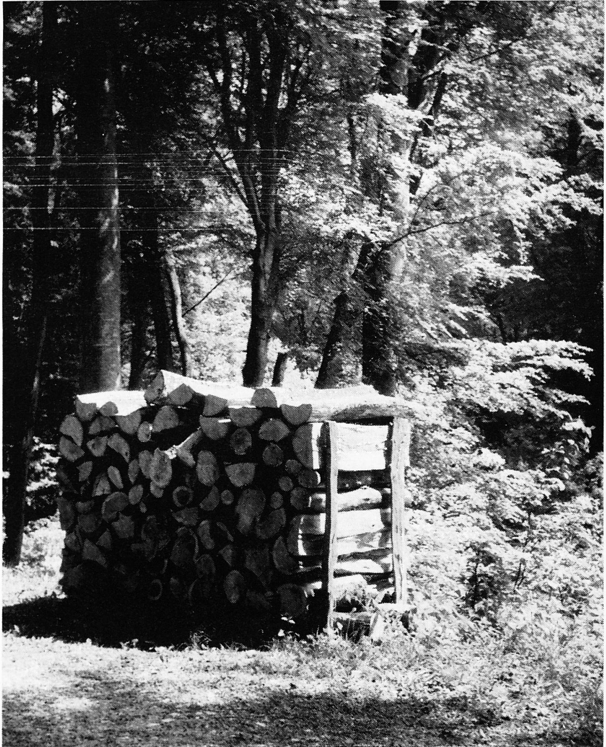
Sonne im Wald

Organe central de la Société d'utilité publique des femmes suisses