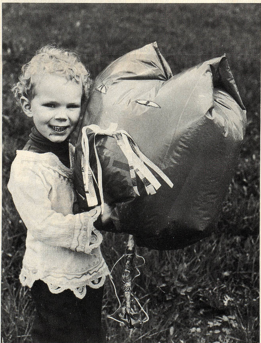
Schau, das hat ja Ohren!

Während zwei andere sich ebenfalls um eine Katze mühten, rief jemand: «Das geht ja us wie ne Vogel!» Und tatsächlich, wenn man verwuschelte Zeitungen in eine Ecke stopfte, gab's einen Schnabel, mit Schnur abgebunden Kopf und Hals, und der obere Sackrand, lose zusammengebunden, ergab die Schwanzfedern. Dass wir noch einen Fetzen Weihnachtspapier fanden, aus dem sich zwei Kerzliaugen ausschneiden liessen, war ein Glücksfall, und dass die Ente eine zweite Ente brauchte zum Anstrahlen, war allen klar. Aber bei Enten blieb es nicht, nein, es gab ein Stehsöili mit abgebundener Schnauze und ein Liegesöili mit Riesenbauch – beide konnten mit Klebband umwickelten Ringelschwänzen freudig wedeln. Von da an brauchte es mich als Erwachsenen eigentlich