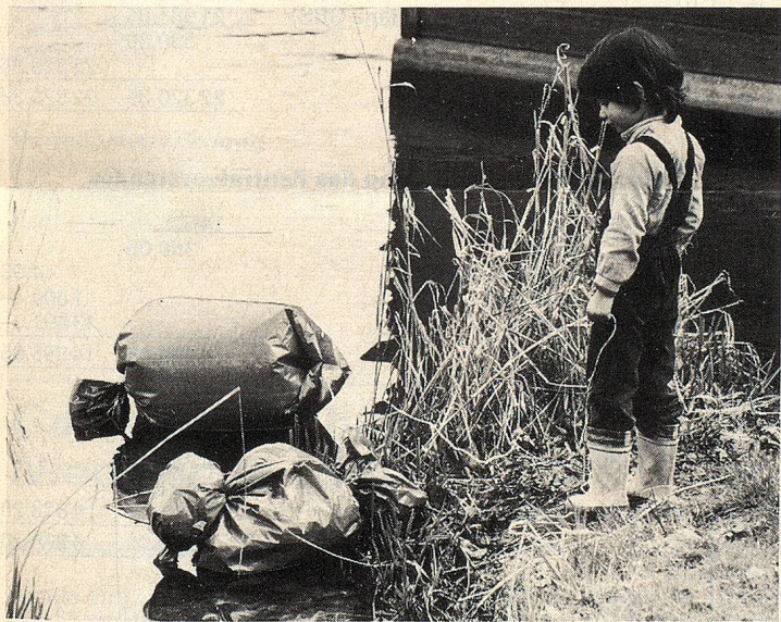
Am Nachmittag gingen wir zum nahen Weiher, um zu schauen, ob Enten und Säuli tatsächlich schwimmen konnten