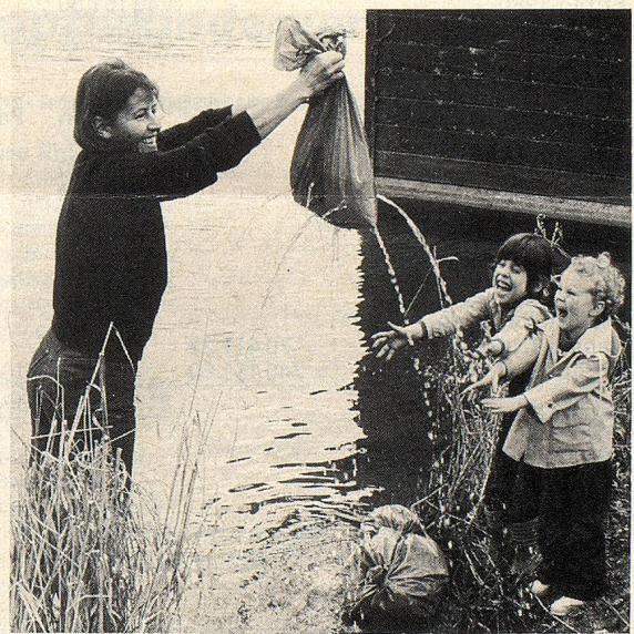
Den letzten Plastiksack füllten wir mit Wasser und verwandelten ihn mit Löchern in einen Duschensack

nicht mehr, das heisst, ich musste einfach dableiben und wieder einmal staunen, wie herrlich Kinder mit etwas Neuem, aus dem Moment Entstandenen ohne Ewigkeitswert spielen können. Aber eben, sie bekamen wohl heute das, was wir ihnen oft vorenthalten, wenn wir ihnen teures Spielzeug kaufen: unsere Zeit, Aufmerksamkeit und Zuwendung.