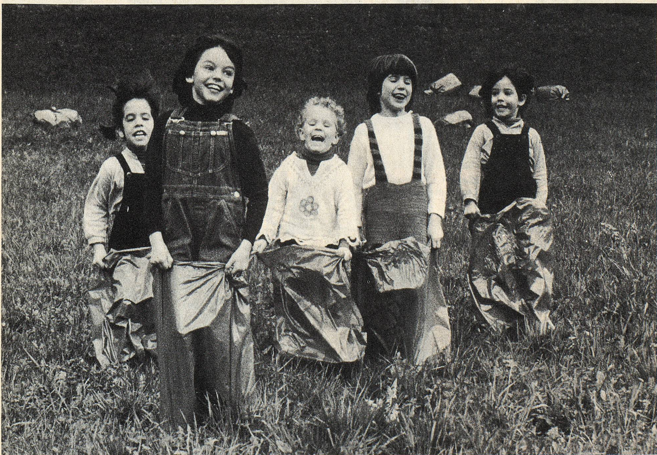
Mir fiel anfangs nur Sackgumpen ein

«Raschle, tätsche, chnuuschte, suse, pfure, pfludere» – jedes dieser Worte nahmen sie mit Entzücken in ihren ohnehin farbigen Wortschatz auf. Luftfangen wurde zum Lieblingsspiel, einfach losrennen und dabei einen Sack voll Luft einfangen, das hatte keines der Kinder vorher je getan! Luft in einem Sack festhalten, einander zeigen, drauf-