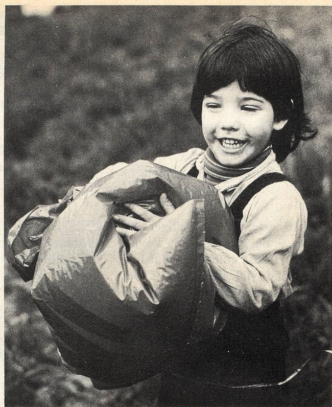
Luft in einem Sack festhalten, einander zeigen, draufboxen und spüren, wie sie anderswo hinwicht

boxen und spüren, wie sie anderswo hinwicht – das war spannende Lebenserfahrung mit einem der vier Elemente. «Schau, das hat ja Ohren», rief die Kleinste begeistert und deutete auf die aufgeblasenen Ecken. Aus Zeitungsstreifen einen Schnauz und zwei Augen brauchte es für ein Katzengesicht, den unteren Sackteil trudelten wir zu einem Schwanz und umwickelten ihn mit Packschnur. Schon sass sie miauend im nassen Gras, die Riesenkatze.