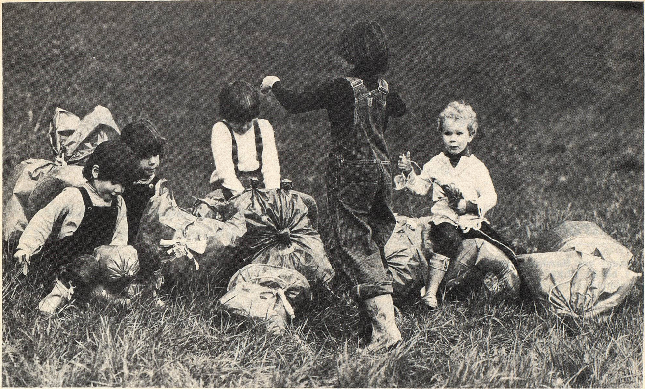
Mit Enten, Stehsäuli und Liegesäuli entstand nach und nach eine ganze Tierschule im Gras