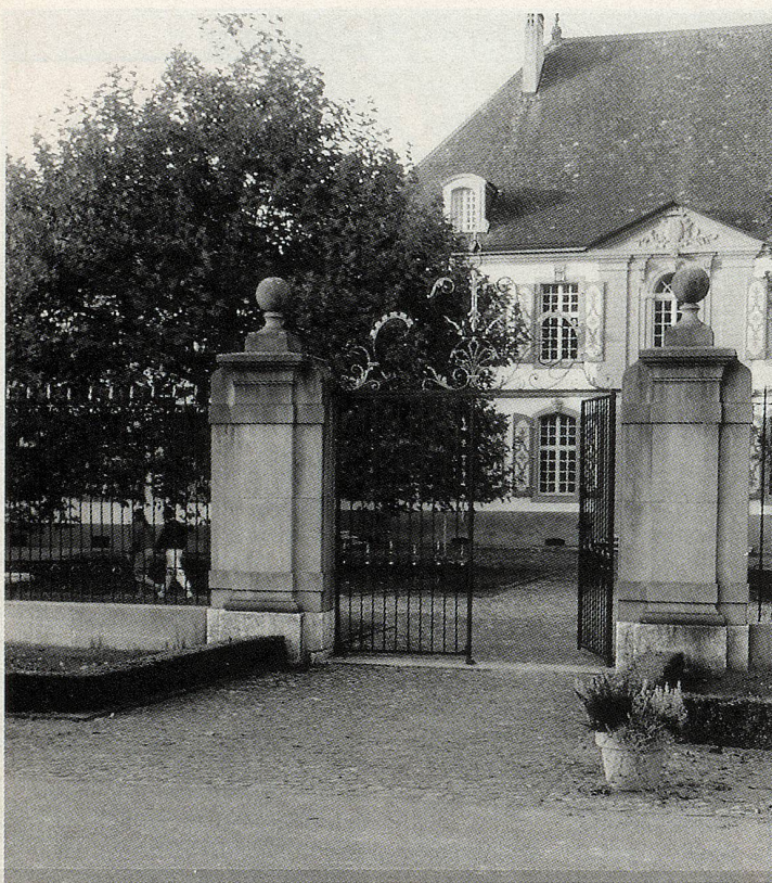
Ein Landsitz, der zum Gefängnis umfunktioniert wurde: Hindelbank