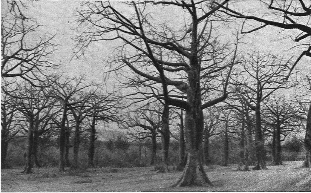
Ceiba-Bestand bei Manta (Trockener Küstenstreifen von Manabi).