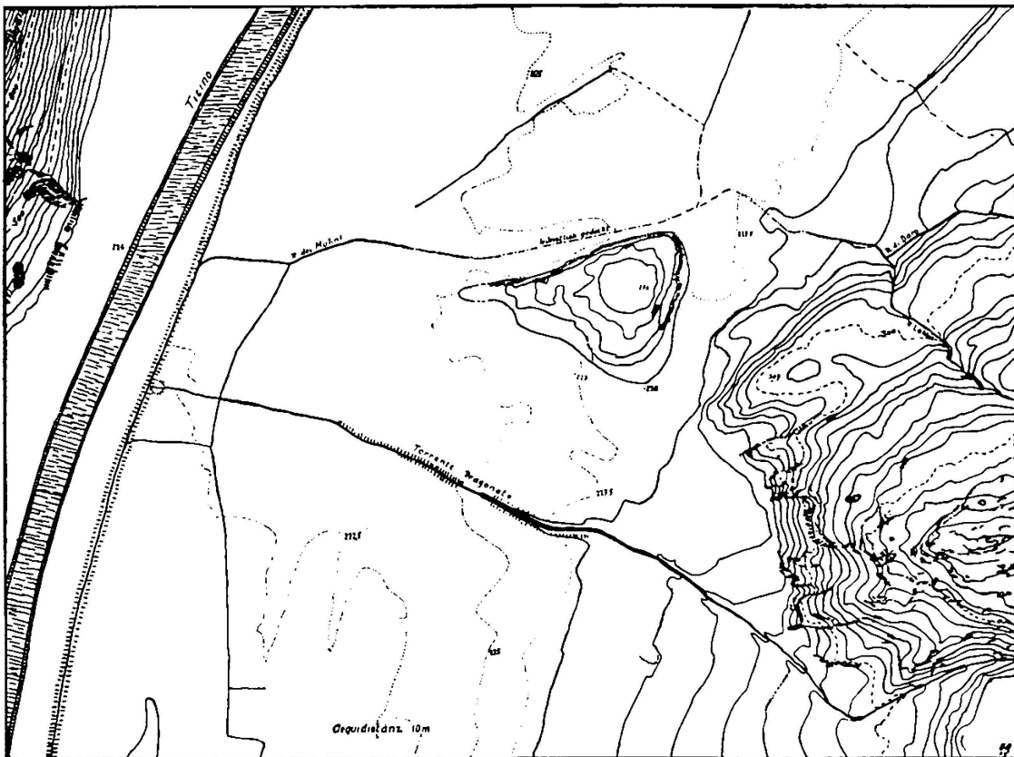
Fig. 2: Bodenformen von Bellinzona.

Nach weitem Wechselfällen gelangte Bellinzona 1396 endgültig unter die Herrschaft Mailands, bis dann nach kurzer Franzosenbesetzung die Stadt in die Hand der Eidgenossen (Uri, Schwyz, Nidwalden) überging (1500, Friede von Arona 1503), die unter Leitung Uris tatkräftig Gotthardpolitik trieben und den Pass bis hinunter an die lombardische Ebene in ihren Besitz zu bringen wussten; die Urner erkannten, Bellinzona sei «ein gut Ort, Schloss und Schlüssel unser Eidgenossenschaft, das uns wohl erschiessen mög» (Lütolf).