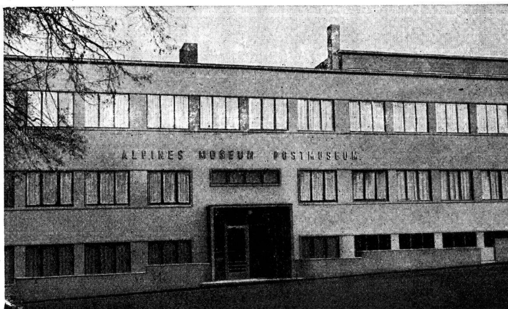
Das Schweizerische Alpine Museum

Es ist kaum denkbar, dass den Gründern Beispiele solcher Ortsmuseen vorlagen, wie sie bereits in Lourdes und in Bagnères de Luchon in den Pyrenäen in bescheidenen Dimensionen bestanden. Vielmehr wurde man durch vorhandenes Material wie Modelle von Klubhütten, von Gletscherpickeln und anderer Sportgerätschaften der Bergsteiger, ferner durch kartographische und statistische Darstellungen und durch Bilder hervorragender Klubisten und Bergführer sowie durch ältere und neuere Abbildungen alpiner Landschaften, wie sie sich zur Hauptsache in den Bibliotheken der einzelnen Sektionen des SAC vorfanden, auf