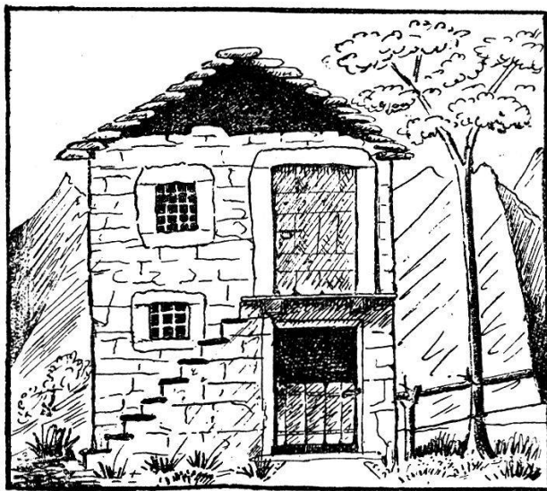
La tipica casa a Vogorno.

gli arreca tali disturbi per l'eccessiva vicinanza, qualche utile sa pure procurargli. Dopo la « buzza » quanta bella e buona legna, già pronta per il focolare, gli lascia sul greto. E durante l'estate per di più, egli può dopo i lavori e durante le giornate piovigginose dedicarsi alla pesca. Le pozze del fiume sono popolate di squisitissime trote che a buon prezzo vengono vendute sul mercato. E la pesca non presenta gravi difficoltà perchè le pozze ampie e profonde s'adagiano tra i pianori del greto, ove facilmente il pescatore può giungere con la sua canna.