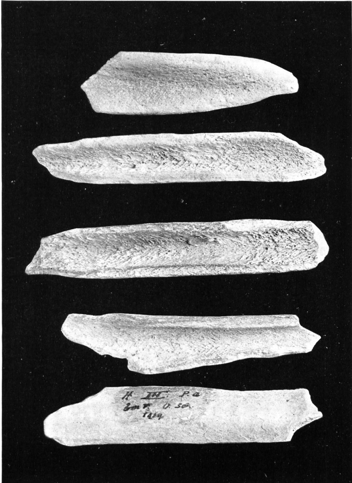
Abb. 20. Knochenwerkzeuge vom Drachenloch.