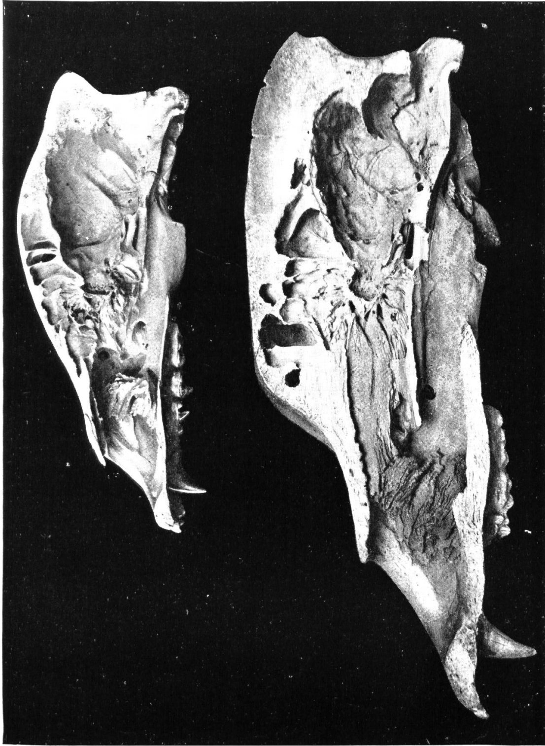
Abb. 18. Längsschnitte durch die Schädel von Ursus arctos und Ursus spelaeus .