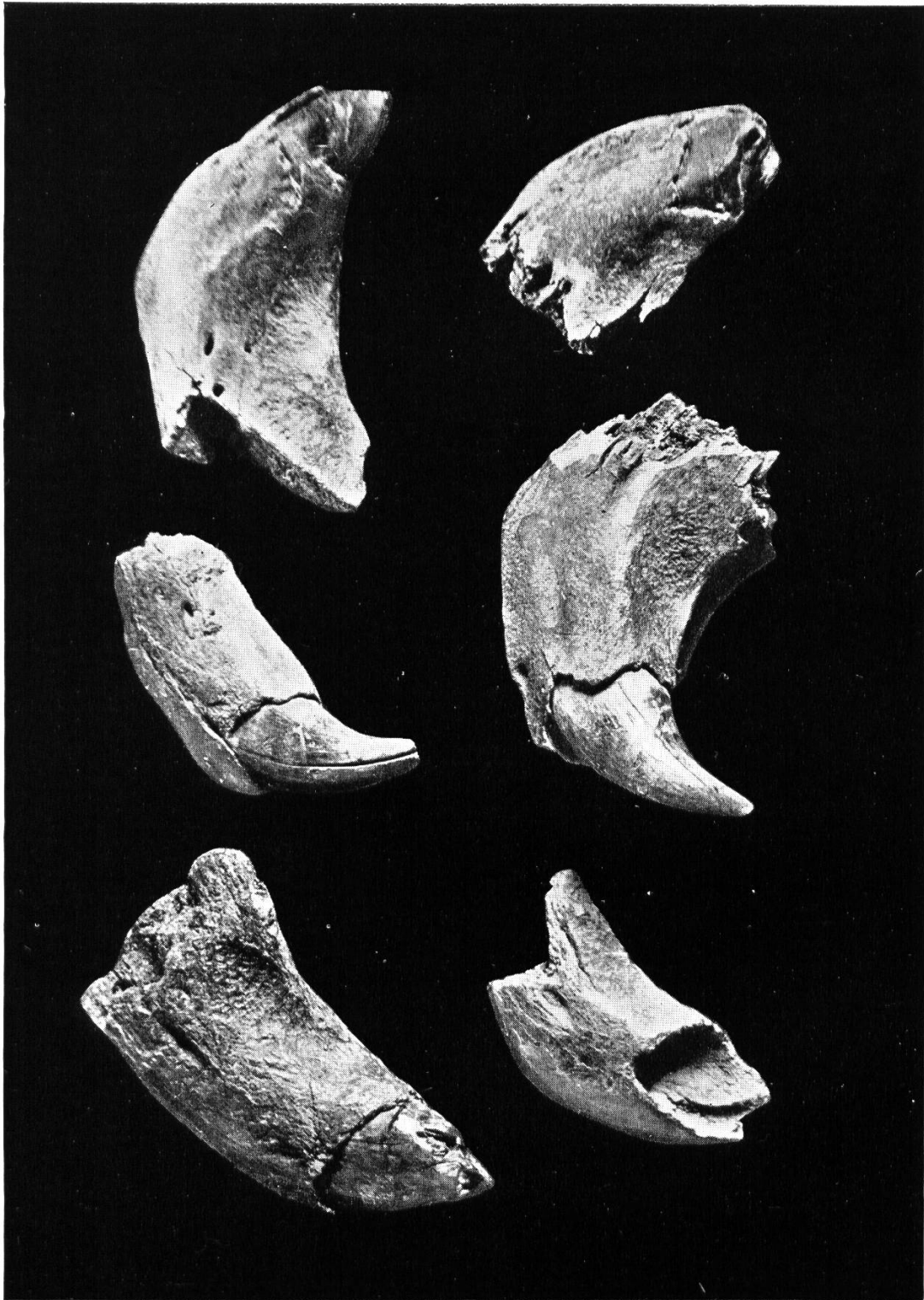
Abb. 25. Gebrochene Bären-Unterkiefer.