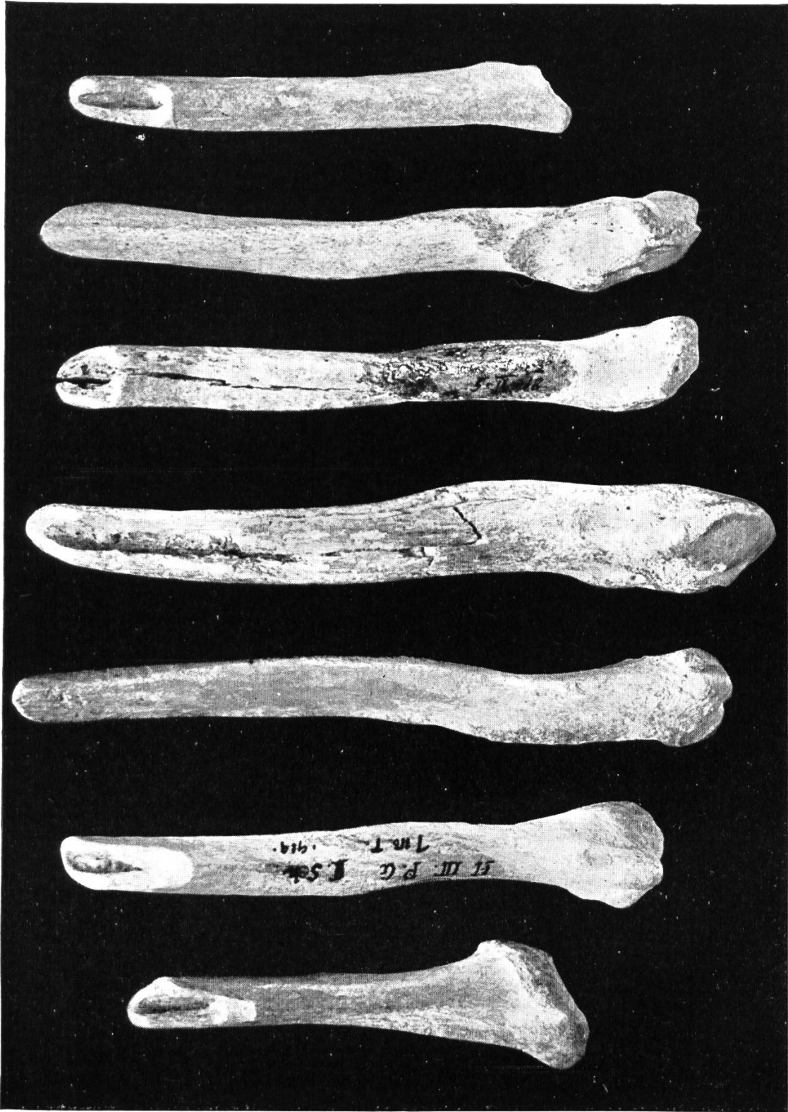
Abb. 21. Knochenwerkzeuge vom Drachenloch.