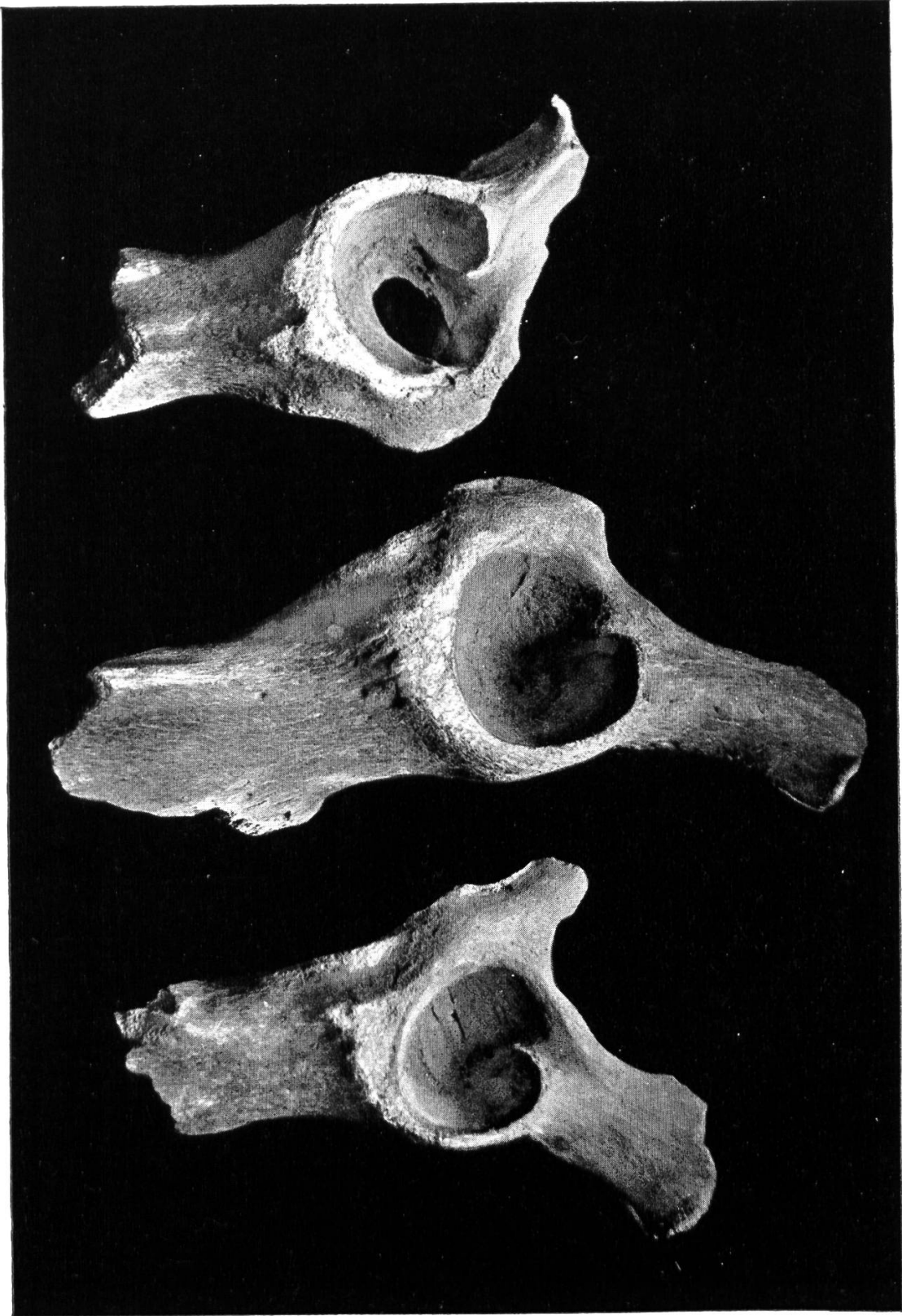
Abb. 24. Abgenutzte Hüftgelenkpfannen.