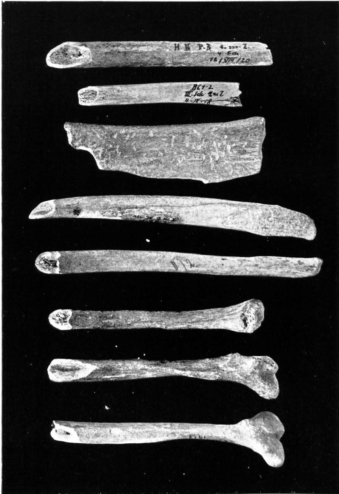
Abb. 22. Knochenbruchstücke vom Drachenloch.