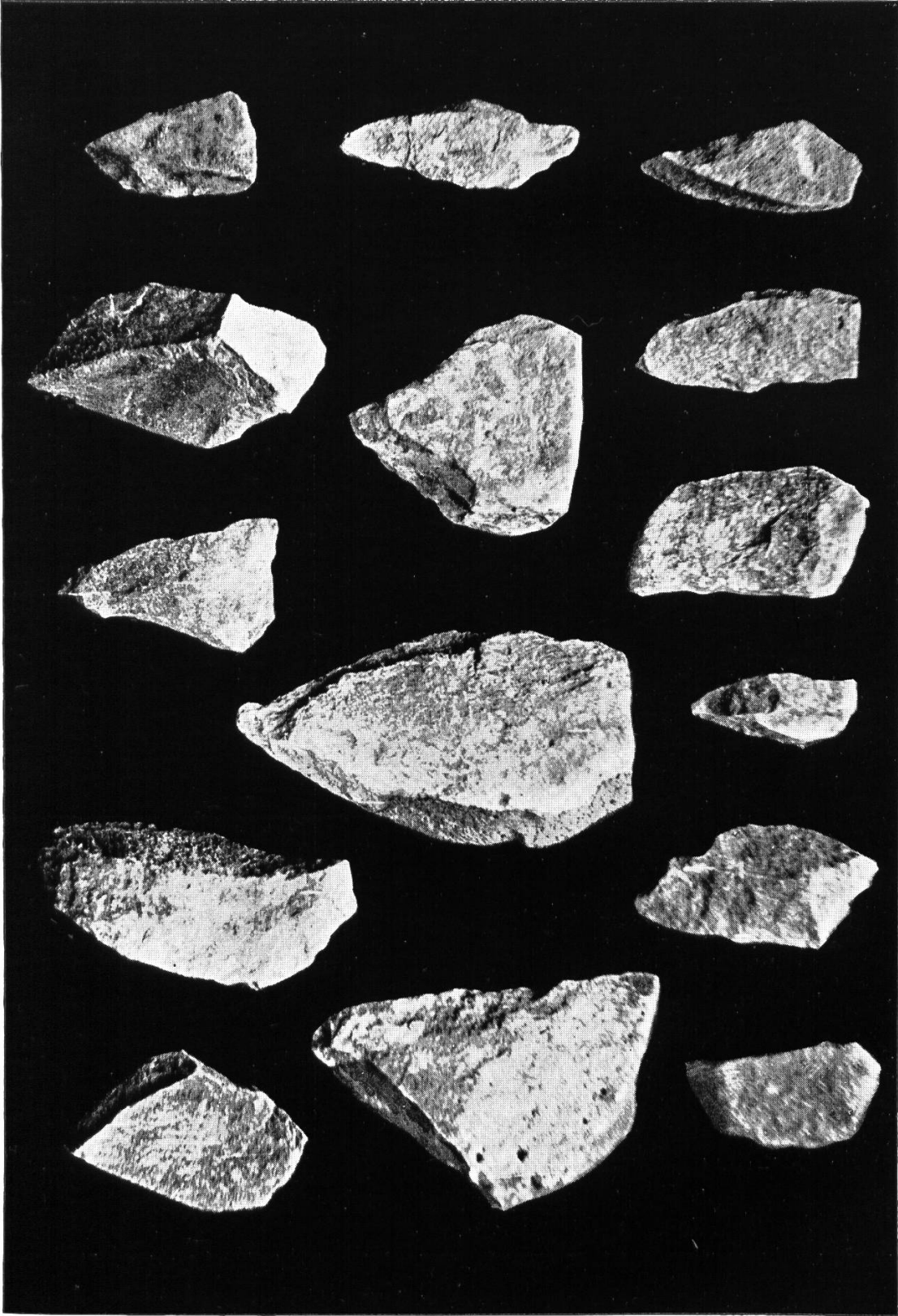
Abb. 26. Steinwerkzeuge vom Drachenloch (Seewerkalk).