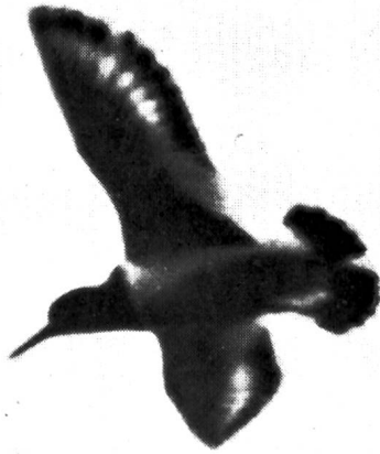
Flugbild des Austernfischers. Sylt, Juni 1929.