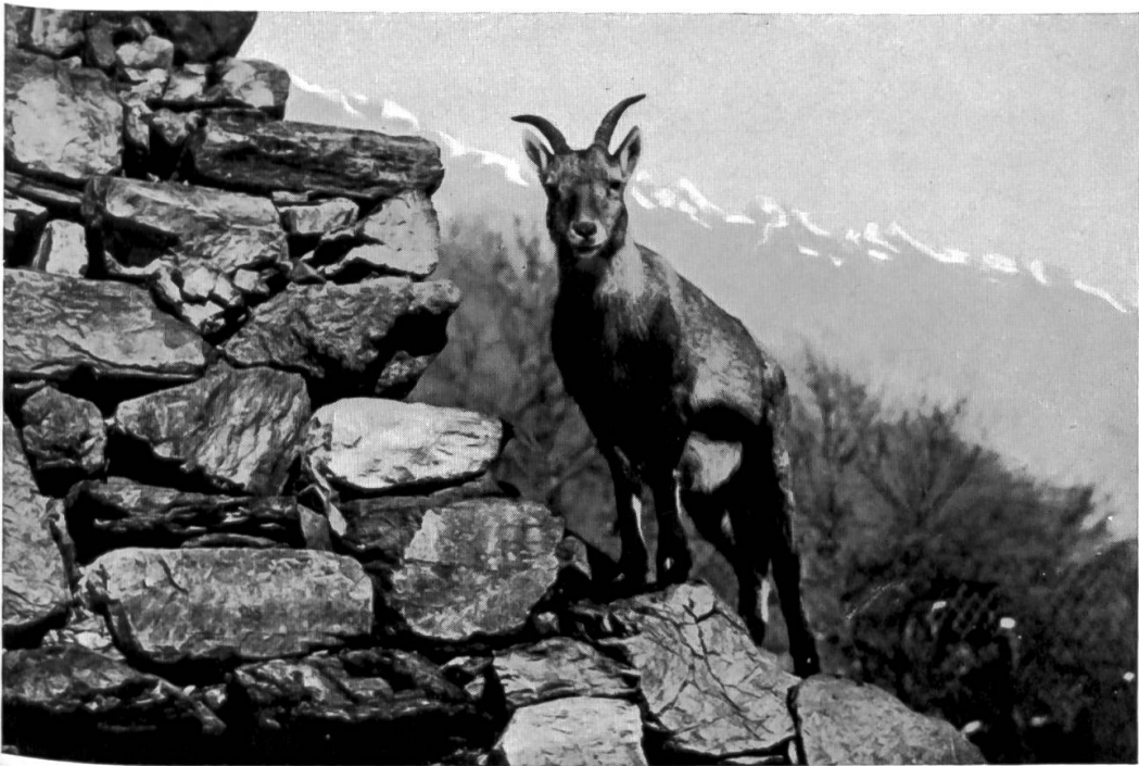
Abb. 5. Steingeiss im Wildpark Interlaken.