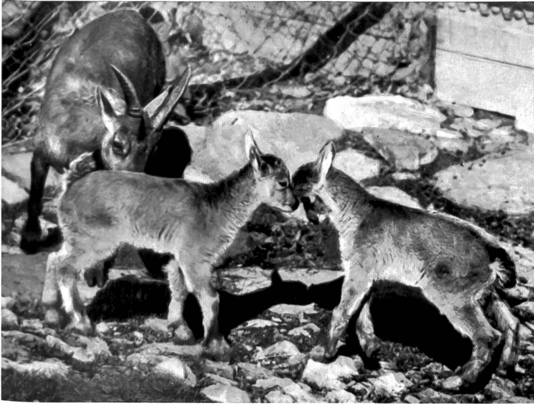
Abb. 4. Steinwild im Wildpark Interlaken.