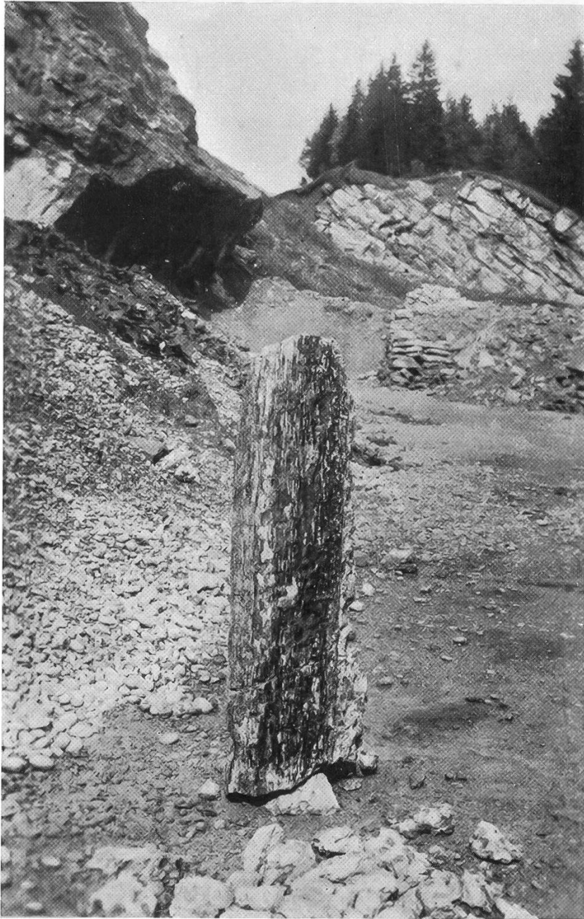
Abb. 1. Fossiler Baumstamm mit Blick auf den Steinbruch St. Anton.