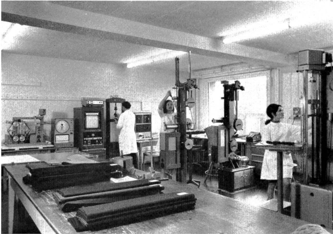
Klimatisierter Prüfraum für physikalische Garn- und Gewebeuntersuchungen.