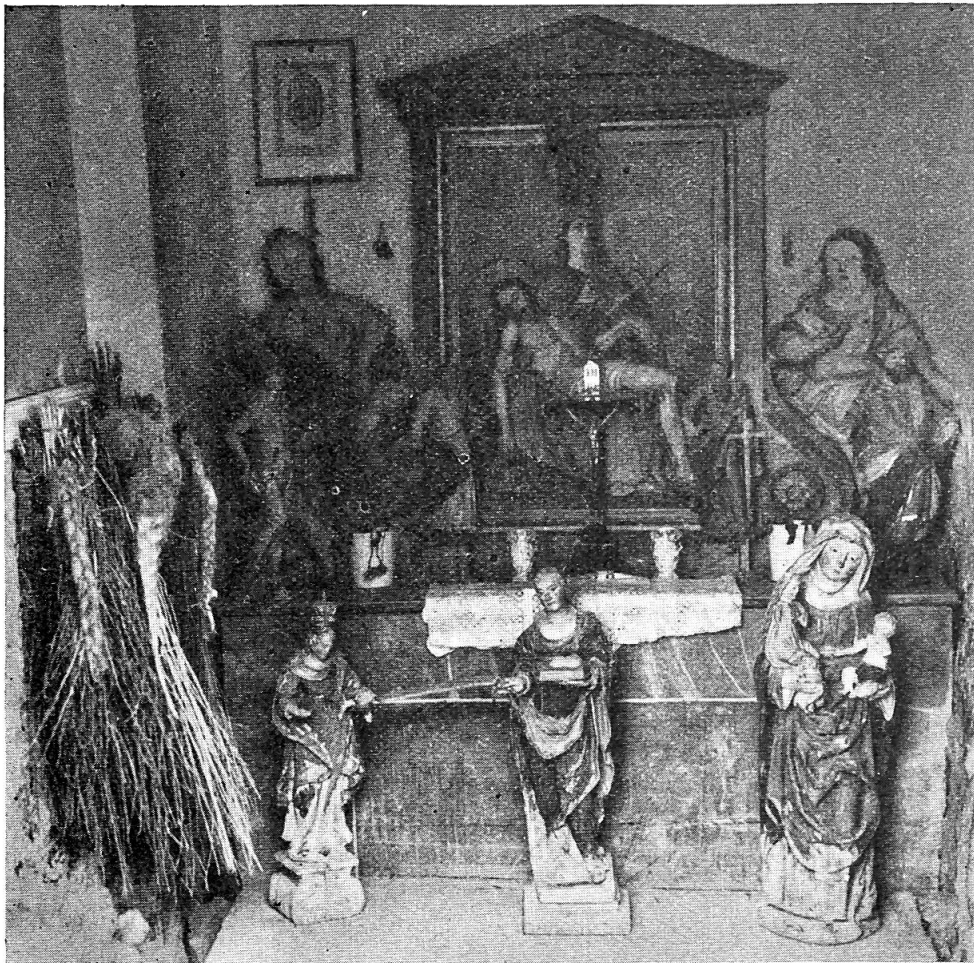
Abb. 8. Birkenruten- und Haarzopfer. Galgenkapelle bei Sempach.

Neulich unternahm der Schreibende Besuche einiger Wallfahrts- und Gnadenorte. Darüber einige Notizen, die das Vorhergehende noch zu ergänzen vermögen. In der Nähe von Hochdorf thront auf einem lindenbeschatteten Hügel die alte Gerichtskapelle zu den hl. „Vierzehn Nothelfern“. Die dortige Dorfschaft hat eine Votivtafel in Holz gestiftet mit der Legende: „Anno 1724, den 6. Tag Brachmonat ist ein schreckliches Wetter entstanden, hat hier in Ursswil in dass Kirchlein geschossen, in demselben sind 21 Personen gewessen, drey hat man für todt aufgehobt, die andern alle sind unverletzt Erhalten worden. Gott, den 14 Nothelfern und der hl. Ottilia sey ewigess Lob und Dank gesagt. Ren. 1784.“ Auf dem Bild ist der Einschlag des Blitzes in die Kapelle und das Wegtragen eines Verletzten dargestellt. An der linken Seitenwand vor dem St. Ottiliaaltar hangen neben den gewöhnlichen Opfer-Beinen, -Armen, -Herzen und -Augen vier grosse kuchenförmige Wachsformen, die ich als Gewichtsoffer auffasse (s. Abb. 7). Ausserhalb des Städtchens Sempach unter