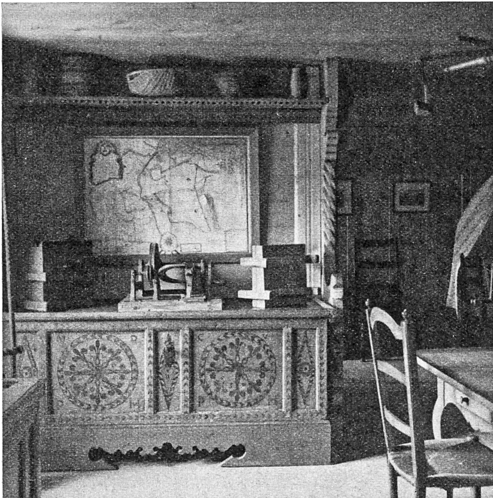
Fig. 1. Au Musée du Vieux Pays-d'Enhaut.

Th. Delachaux, Le Musée du Vieux Pays-d'Enhaut à Château-d'Oex. — Henri Naef, Art populaire et Folk-lore au Musée gruérien. — Mitteilungen. — Bücherbesprechungen.