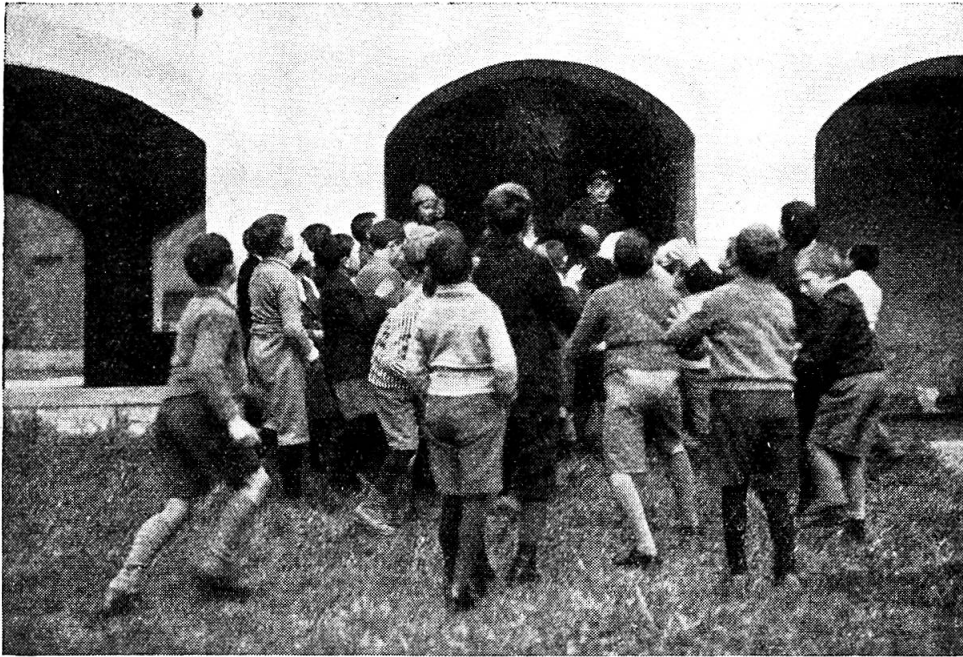
Abb. 5. Blankenauswerfen.

silberne Platte; während der Diakon aus silbernem Krug Wasser über den Fuss giesst, nimmt der Propst die Waschung vor, trocknet den Fuss und nach einem Kuss geht es der Reihe nach weiter. Judas streckt den linken Fuss zur Waschung hin. Hierauf spannt der Chordierer ein ca. 8 m langes leinenes Tuch in Brusthöhe vor die Jünger aus. Jetzt erscheint der Stiftsweibel im roten Mantel mit 12 Brotweggen auf einer grossen Zinnplatte. Jeder Jünger erhält von ihm ein mit 2 Zwanzigrappenstücken bestecktes Brötchen, das er hinter dem leinenen Tuch unter dem Ueberrock verbirgt. Judas allein nimmt es unter den Arm. Die Fusswaschung ist vorbei. Die Jünger ziehen sich, hinter den Choraltafel zurückgekehrt, die Schuhe wieder an und verlassen die Kirche. Vor derselben hat sich inzwischen das junge Volk aufgestellt. Nun entsteht ein Kampf um den Beutel des Judas, während dessen er mit seiner Quaste sich heftig wehrt und dazwischen aus seinem Beutel die dreissig Silberlinge in Form der sog. Blanken, vermisch mit Sägemehl, unter das Volk wirft, das in wildem Gemenge nach diesen hascht (Abb. 5 und 6). Denn glücklich ist, wer eine Blanke erwischt. Die „Blanken“ sind kleine, flache Rädchen von Blei, etwa 4 bis 5 cm im Durchmesser und mit 6 Speichen versehen, die von den Knaben in besondern Modeln von Ziegel- oder Backsteinen gegossen werden. So entwickeln sich kirchliche Liturgie und dramatische Szene zu einem bodenständigen Brauchtum.