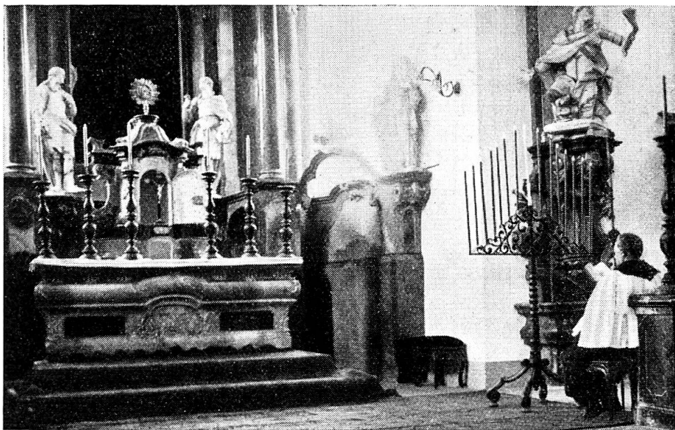
Abb. 7. Tenebraelleuchter mit Chordienner.

Erhebend sind die Ceremonien während des Karfreitages, sie erinnern in ihrer Einfachheit an die liturgischen Bräuche der ältesten Zeit. Lesungen, Gesänge und Gebete lösen einander ab. Es herrscht höchste Trauerstimmung, die Altäre sind jeden Schmuckes beraubt. Das Kreuz auf dem Hochaltar, das mit einem violetten Tuche — noch eine Erinnerung an das mittelalterliche Fastentuch — bedeckt war, wird enthüllt! Hören wir noch von einem Familienbrauch an diesem Tage! Weh dem Kind, das am Morgen des Karfreitages das erste Wort spricht. Den ganzen Tag über wird es als „Karfreitags-rafele“ geneckt. Frauen und Männer erscheinen während der drei letzten Tage der Karwoche in schwarzer oder dunkler Kleidung in der Kirche.