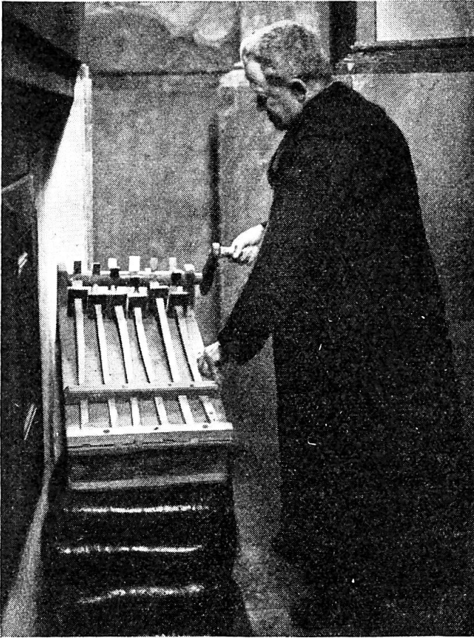
Abb. 2. Chordierer mit Karwochenraffel.

einem sichern Ort des Gartens auf. Nach und nach werden die Äpfel geplündert und von der Familie gegessen zum Schutze vor Erkrankung; die übrigen Bestandteile aber werden im Estrich versorgt und bei drohenden Gewittern während des Sommers ins Feuer geworfen, um den Blitz vom Hause und der Scheune fernzuhalten. Früher war es Brauch, bei der Palmprozession den Palmesel mitherumzuführen. Von diesem Brauch ist aber nur noch der Name Palmesel übrig geblieben, der demjenigen zu teil wird, der am Palmsonntag zuletzt aufsteht.