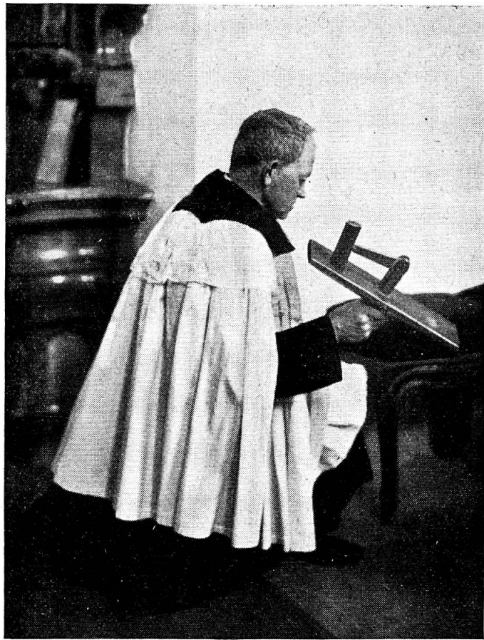
Abb. 3. Chordierer mit Karwochen- chlöpfer.

einem hohlen Holzkasten, auf dem 6 bis 8 Holzhämmer befestigt sind, die durch ein von Hand getriebenes Rad in Bewegung gesetzt werden (Abb. 2). Dadurch entsteht ein stark klapperndes Geräusch, das vom Kirchturm aus weithin vernommen werden kann. Die Raffeln erinnern an die Zeit, wo es noch keine Kirchenglocken gab, und dienten wahrscheinlich in frühester Zeit als Abwehrzauber. Anstatt der Kirchenglocken wird während des Gottesdienstes von einem Chorknaben, bei uns „Chäppeli-bueb“ geheissen, mit einem sog. „Chlöpfer“ ein rhythmisches Geräusch wie täm - tä - täm erzeugt. Der Chlöpfer besteht aus einem Brett von Hartholz, das von einem Rundstab durchbohrt ist. Dieser bildet auf der Unterseite des Brettes den Handgriff und auf der Oberseite die Stütze für einen mit ihr durch ein Gelenk verbundenen Holzhammer, der durch rhythmische Arm-bewegungen das Geräusch erzeugt (Abb. 3). Frauenpersonen mit unermüdlichem Mundwerk bezeichnet man heute noch mit der Redeweise: „Du bist e rähti Rafele“ oder, wenn sie dazu noch klatschüchtig ist: „Du bist e rähti Chlöpf.“ Wenn Kinder ihre Eltern fragen, warum die Glocken nicht mehr läuten, be-