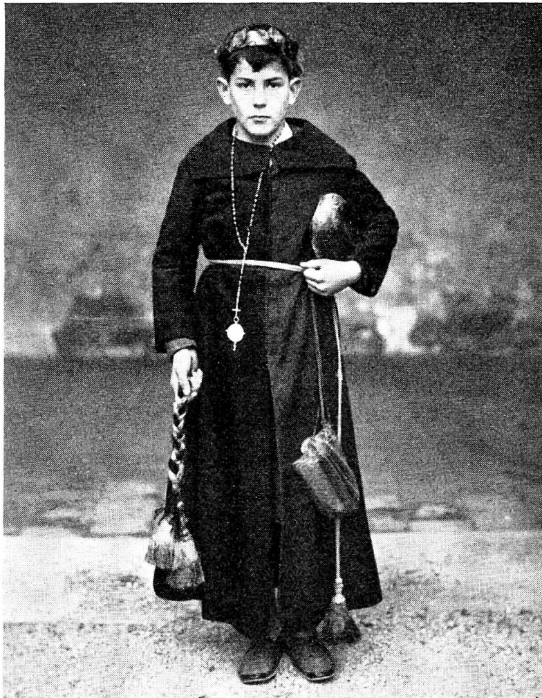
Abb. 1. Judas.

E. Müller-Dolder: Von heutigen und verschwundenen Karwochenbräuchen in Beromünster. — A. Senti: Bräuche und Symbole im Marchwesen. — Petitionen um Dispens von der Kanzelverkündigung. — Zauber und Gespenster. — Jahresbericht und Jahresrechnung für 1938. — Die Schweizerische Gesellschaft für Volkskunde an der Landesausstellung. — † Dr. h. c. Emanuel Friedli. — † Albert Wesselski. — Die Jahresversammlung in Solothurn.