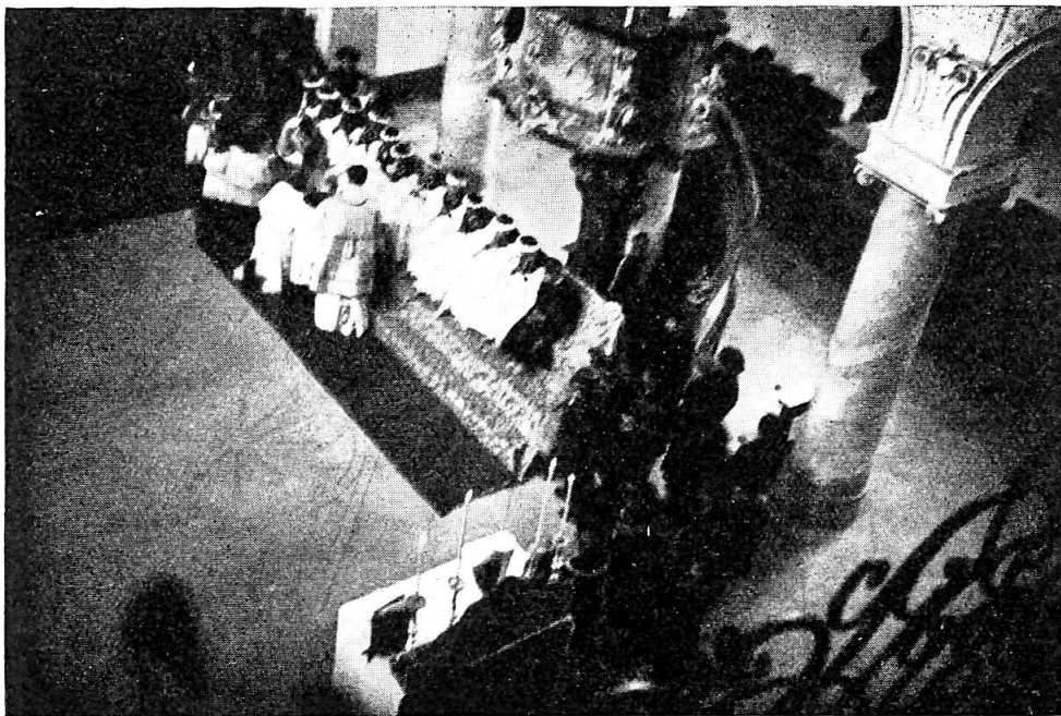
Abb. 4. Fusswaschung in der Stiftskirche. — Judas rechts aussen.

Am Gründonnerstag kommt auch das erste „Grün“ auf den Mittagstisch in Form eines Brunnkressesalates oder als „Aronendätsch“ (Omelette aus Aronenkraut). Der „Grünen Geiss“, so heisst der Spätaufsteher an diesem Tag, hält man ein Büscheli Gras vor die Nase. Eine besondere Note erhält der Hohe Donnerstag durch die „Fusswaschung“. 12 Schüler — die sog. „Jünger“ — besammeln sich mit dem „Judas“ in der Kapitelsstube des Stiftes, die erstern mit dem weissen Chorhemd angetan, ein Beffchen (Rabat) um den Hals, einen weissen Kranz auf dem Haupt und den Filigranrosenkranz in der weissbehandschuhten Hand, letzterer mit einem roten Mantel und Kragen, einem grünen Kranz auf dem Kopf und einem Gurt mit Lederbeutel um den Leib, in der Hand eine Quaste (Abb. 1). Der Grösse nach, Judas zuletzt, geht der Zug zur Kirche, hinter deren Choraltar das Schuhwerk abgelegt wird. Der Stiftsцерemoniar führt die Jüngerschar ins Kirchenschiff, wo eine grünausgeschlagene Bühne mit Trittbrett, Sitzbank und Rückwand sie aufnimmt (Abb. 4). Gegenüber nimmt die Geistlichkeit Platz. Nach Verlesung des Evangeliums von der Fusswaschung umgürtet sich der Stiftspropst mit einer weissen Leinenschürze. Diakon und Subdiakon in violetten Gewändern sind ihm bei der Fusswaschung behilflich. Jeder der Jünger hebt den rechten Fuss, unterstützt vom Subdiakon, über eine grosse