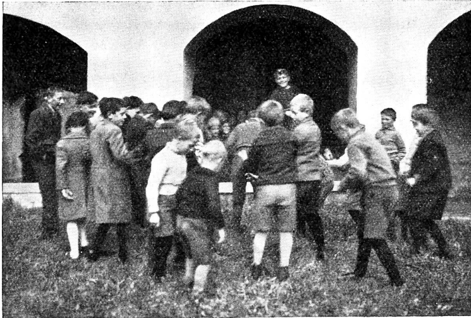
Abb. 6. Blankenauswerfen.

Während ausserhalb der Kirche das Blankenauswerfen unter lebhafter Teilnahme des Volkes allmählich ausklingt, bereitet sich im Kircheninnern eine neue volkstümliche Szene vor. Das Heilige Grab wird aufgerüstet. Vor dem grossen Gitter, das den Chor vom Schiffe trennt, erhebt sich ein Gerüst mit Leinwandkulissen, auf denen das Leiden unseres Herrn in seinen verschiedenen Phasen realistisch zur Darstellung gebracht ist. In einer ausgesparten Bogennische befindet sich das Heilige Grab, das wie die ganze Bogennische mit farbigen Glaskugeln verziert ist. Letztere werden durch elektrisches Licht (früher Oellämpchen) zum Leuchten gebracht, ebenso die Hänge- und Ständerfackeln. Daneben brennen noch zahlreiche Wachskerzen. Besonders am Abend wirkt die magische Beleuchtung sehr stimmungsvoll. Ständig ist das Heilige Grab von Andächtigen besucht. Noch zu meiner Jugendzeit war es Brauch, dass Wallfahrten zu 7 Heiligen Gräbern vorgenommen wurden. Mit dem Verschwinden der Gräber ist dieser alte Brauch in Abgang gekommen. In Beromünster lässt sich das Heilige Grab nicht wegdenken. Mit einer rührenden Pietät hält unser Volk an der spielhaften Gestaltung dieses kirchlichen Brauches fest. An die Beleuchtung des Grabes knüpft sich auch die heute noch überall übliche Redensart: „Du machst Auge wie Heiliggrab-Chugle“.