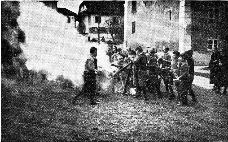
Abb. 9. Verteilung der „Osterfeuerscheiter“.

tafeln hergestellt, geweiht und als Agnus Dei statt der Osterkerze an Rompilger verteilt, damit sie sich bei den verschiedenen Fährnissen des Lebens damit bedienen. Sie werden in Frauenklöstern auch in kleine Holzkapseln künstlich gefasst und an Laien ausgeteilt, die sie als sog. „Teufelsjägerli“ in der Tasche mittragen.