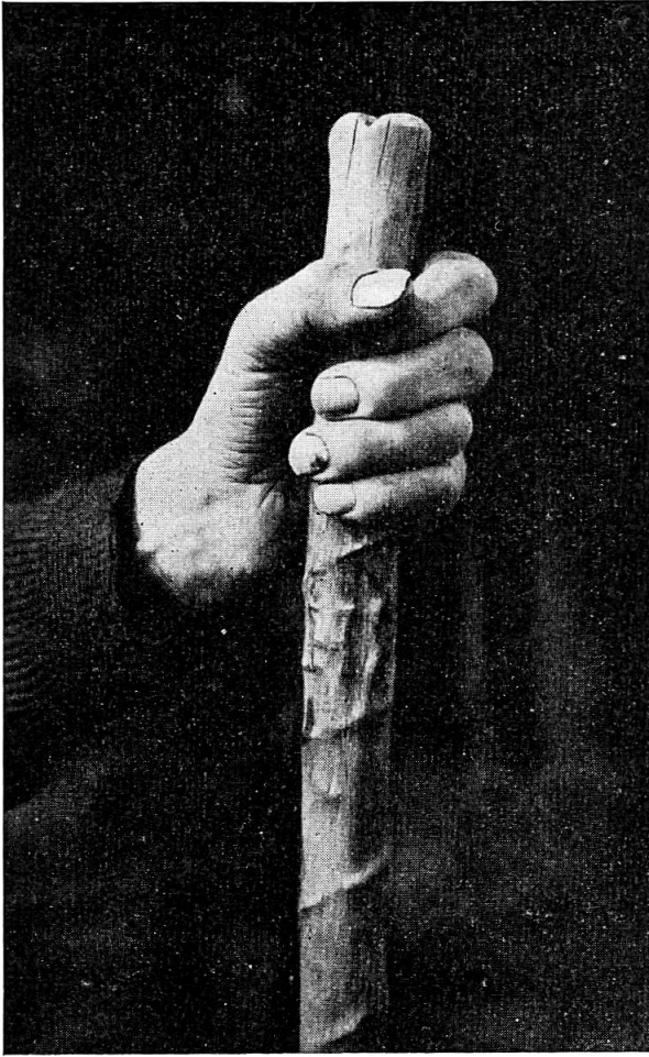
Räfstock, „ghickt und brönnt“.