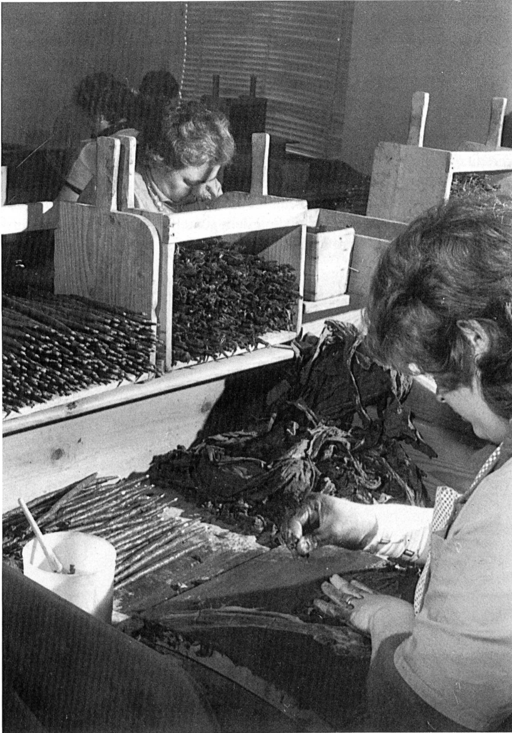
Abb. 2. Blick auf den Arbeitsplatz einer sigaraia. Das Plastikgefäß links im Bild enthält die klebrige concia zum Bepinseln der Umblätter.

Zigarren von Hand herstellen. Einheimische Arbeiterinnen und Arbeiter sind an einer Hand abzuzählen. Die Tessiner wenden sich nach Möglichkeit Lehrberufen zu und wollen offenbar von der harten Fabrikarbeit und von tabakgebeizten Händen nichts wissen. Die überwiegende Mehrheit der sigaraie kommt von Intra und Cannobio her bei Valmara über die Grenze. Viele Mädchen und Frauen werden von Angehörigen, die