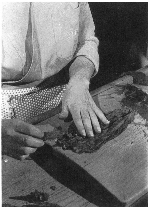
Abb. 5. Das Vorbereiten der Einlageblätter

Die Arbeitszeit einer Zigarrenmacherin dauert von Montag bis Donnerstag je 9 und am Freitag 8 Stunden. Die Handarbeit wird im Akkordlohn per 1000 Stück Zigarren bezahlt. Sämtliche Arbeitsbedingungen sind durch kantonale Gesetze sowie durch einen Gesamtarbeitsvertrag zwischen der Tessiner Tabakindustrie und den Gewerkschaften ausgehandelt. Die vertragliche Anlernzeit einer sigaraia beträgt 3 Monate. Es dauert aber ein halbes bis ein ganzes Jahr, bis unter der Anleitung einer «maestra» eine perfekte Arbeitsleistung – rund 1000 Zigarren im Tag – erbracht wird. Nach Tagen oder Wochen zeigt es sich, ob die Arbeiterin genügend Fingerspitzengefühl mitbringt, um den delikaten Rohstoff Tabak in den Griff zu bekommen und dem hohen Arbeitstempo gewachsen zu sein. Das Endprodukt muss nicht nur der äusseren Form nach einwandfrei ausschauen; auch seine innere Beschaffenheit soll dem Raucher durch die genau richtige Luftigkeit und Dichte des Tabaks den echten Genuss seiner Zigarre ermöglichen.