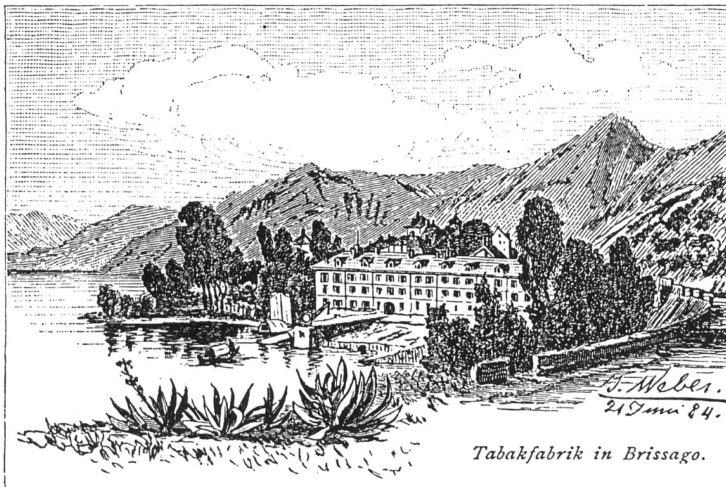
Xylographie nach einer Zeichnung von J. Weber, 1884.

Materialien des Schweizerischen Wirtschaftsarchivs, Basel.