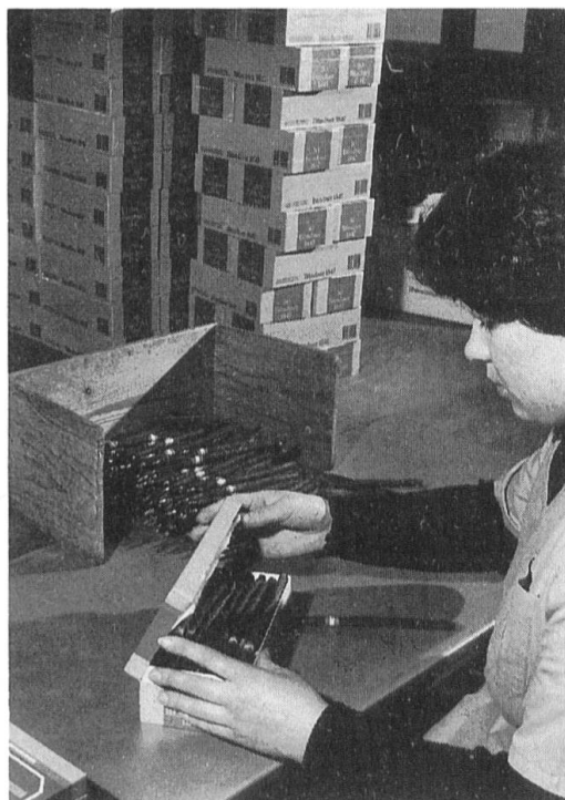
Abb. 11. In der Packerei.