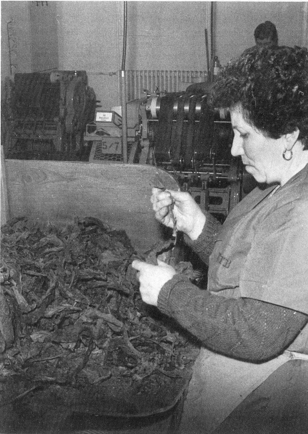
Abb. 1. Das Entrippen der Tabakblätter geschieht von Hand oder maschinell.

Ich danke ihr auch an dieser Stelle herzlich für ihre geduldige und einfühlsame Arbeit.