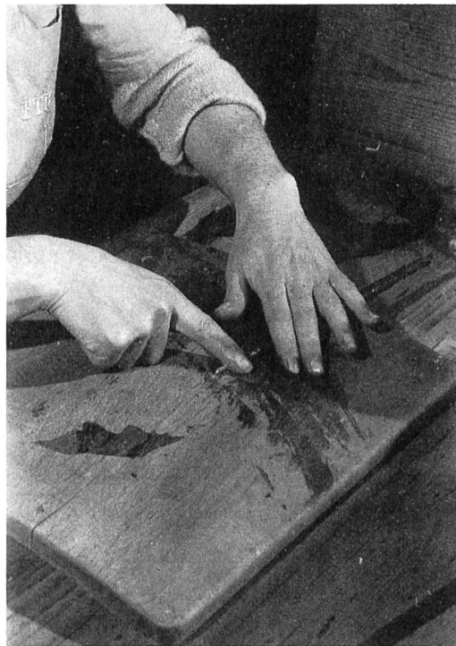
Abb. 8. Das Mundstück muss besonders satt sitzen. Sonst ärgert sich später der Raucher schon beim Anzünden seiner Brissago.