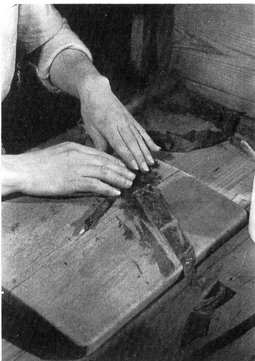
Abb. 7. Beim Einrollen des Wickels in das Umblatt dürfen keinerlei Risse oder Löcher entstehen.

Am Arbeitsplatz einer sigaraia (Abb. 2). Die Brissago besteht aus einer Einlage (interno) aus Virginia- und Kentucky-Tabak, die in ein Umblatt (sottofascia) aus Kentucky eingewickelt ist, und dem Virginia-Deckblatt (coperta), das der Zigarre das Qualitätsprädikat «Virginia» verleiht. Vor dem Einrollen wird das Deckblatt mit der «concia», einem mit spanischem Valencia-Weisswein und mit geheimgehaltenen Ingredienzien zubereiteten Weizenstärke-Leim, bestrichen. Beim Einwickeln der Einlage versieht