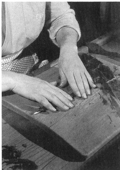
Abb. 6. Diese werden beidhändig zusammen mit dem Halm zu einem Wickel geformt.