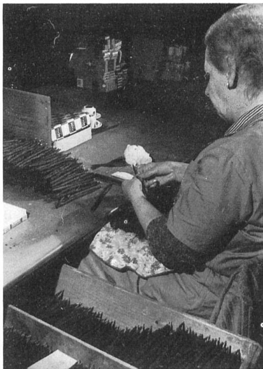
Abb. 10. Das Beringen der Brissagos.

Trocknen, abkühlen, befeuchten. Jetzt gelangen die Brissagos mit der Brandseite nach unten in grosse Metallkästen. Diese schiebt man zu einem dreistündigen Trocknungsprozess in den Ofen. Bei diesem Vorgang wird die Temperatur nach und nach auf 110° Celsius gesteigert. Nach einer raschen Abkühlung und leichten Befeuchtung nehmen die Zigarren den Weg ins Lager. Der Geruch frisch getrockneter Brissagos kann auch einen Nichtraucher begeistern – sie duften ähnlich wie frisch gebackenes Brot.