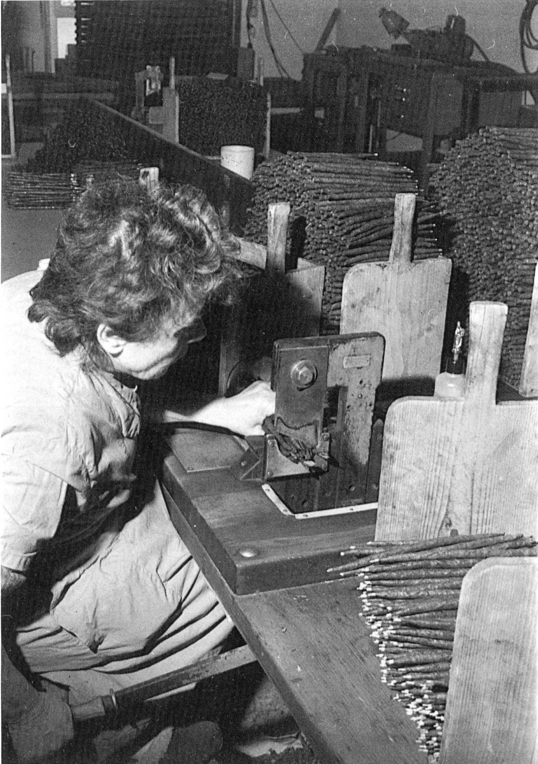
Abb. 9. Unter der Guillotine erhalten die Brissagos die vorgeschriebene Länge von 21 cm.

Kontrollieren und zählen. In einem Nebenraum sind Frauen damit beschäftigt, die Zigarren zu kontrollieren und zu zählen. Hier wird die Arbeitsleistung jeder sigaraia registriert. Auffallend sind die bei jedem Arbeitsgang wiederholten Qualitätskontrollen. Diese tragen dazu bei, dass der Ausschuss bei weniger als einem Prozent der Produktion liegt. Das Deckblatt darf nicht den geringsten Riss oder das kleinste Loch aufweisen – der