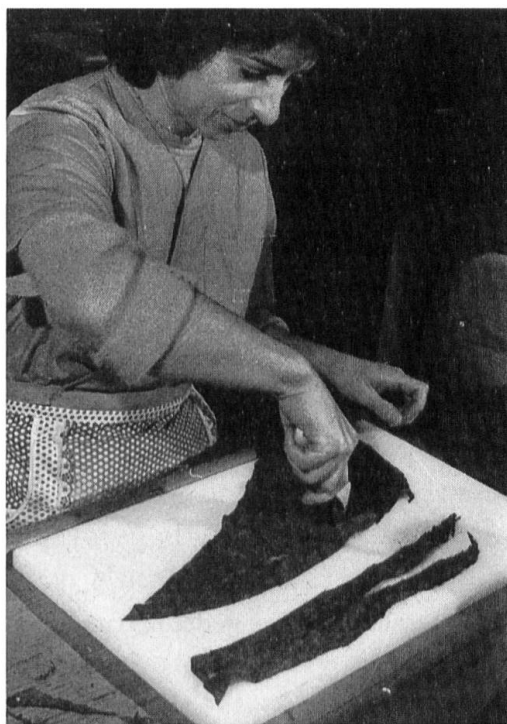
Abb. 4. Das Ausschneiden der Deck- oder Umblätter mit dem rotello erfordert besonderes Geschick.