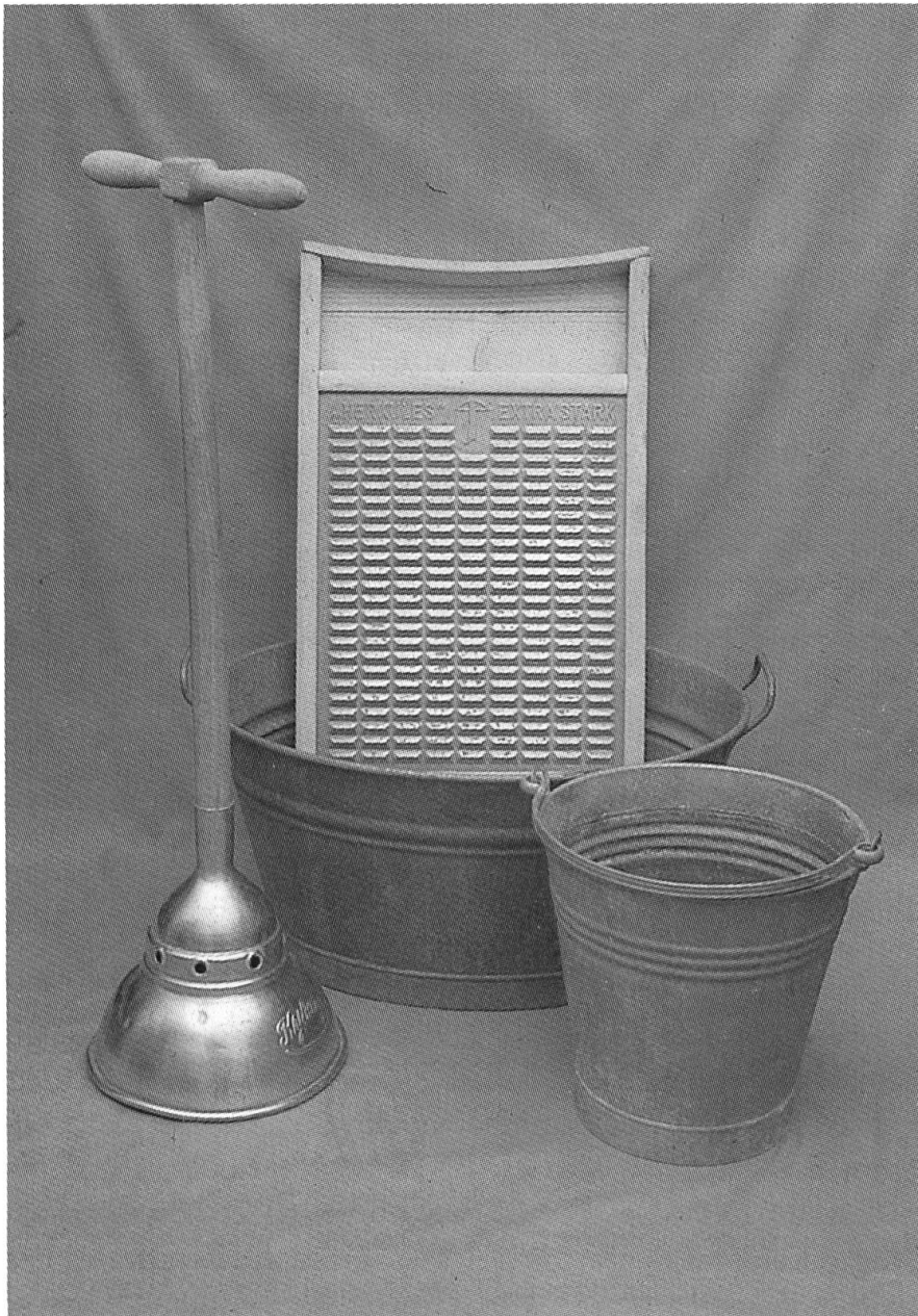
Waschutensilien aus Blech. Museum Neuhaus.

ler. Diese Räume hat die Spenglerei auch mit den nötigen Apparaten, Geräten und Möbeln aus eigener Fabrikation oder zunehmend aus dem Verkaufsgeschäft eingerichtet.