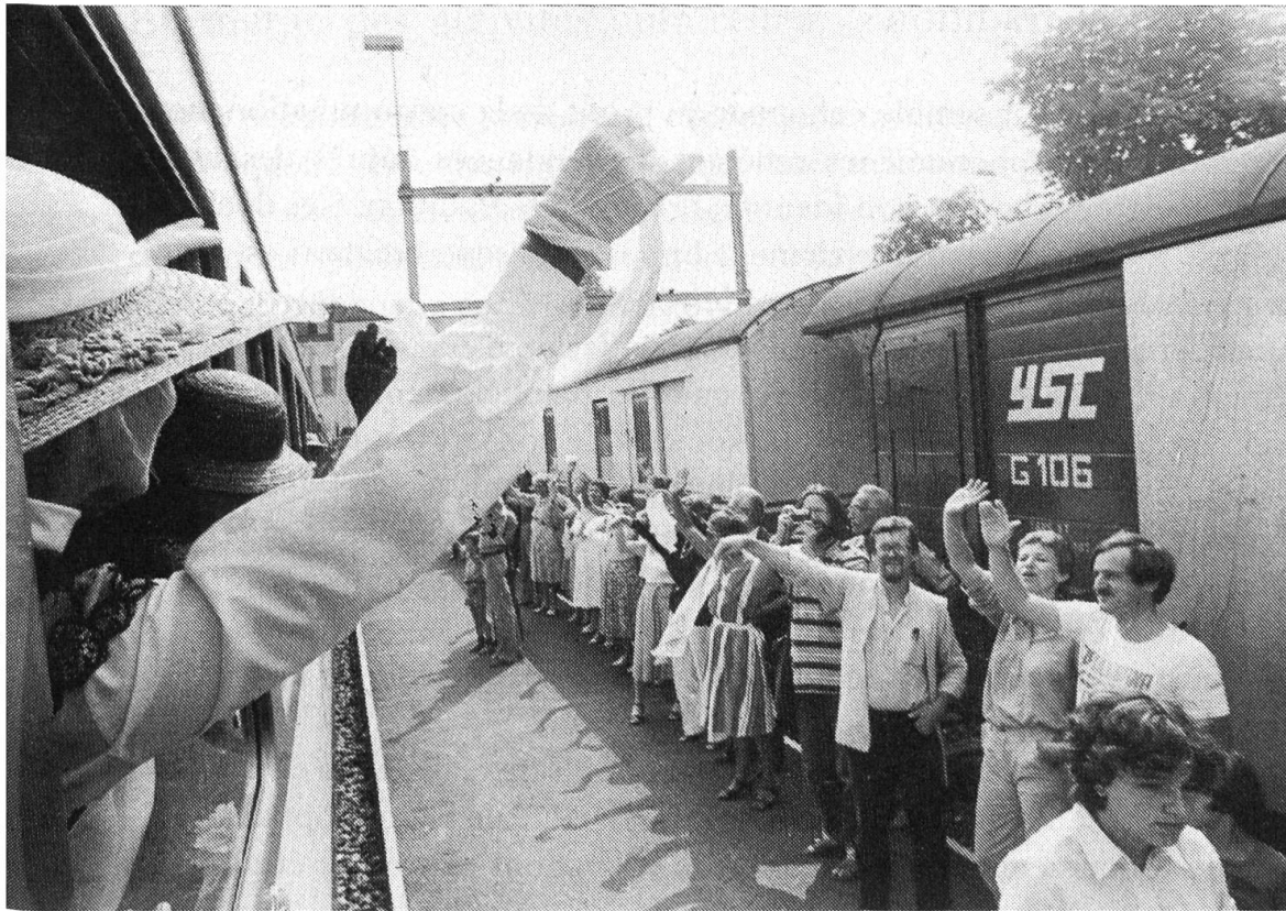
Fig. 9. Jeux du Castrum 1983: le départ du «train théâtral»