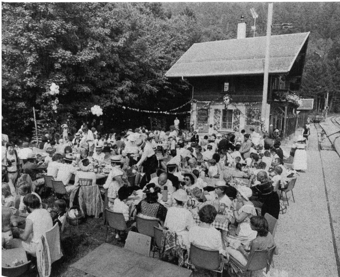
Fig. 10. Jeux du Castrum 1983: acteurs et public sont du voyage; la scène est installée devant la gare de Six-Fontaines (VD); goûter champêtre